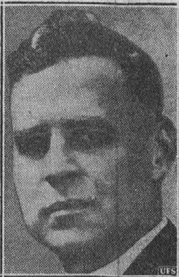
Na sliki je Viley Blount Rutledge, dekan pravne fakultete univerze države Iowa...