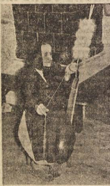
Adlešičeva teta še vedno pridno suče kolovrat

okrog pašnika, v njej pa je električni tok, ki žival stresa in ustraši, da ne uide v škodo na njivo, marveč se lepo vrne past. Kmet je ogledoval, razmišljal in