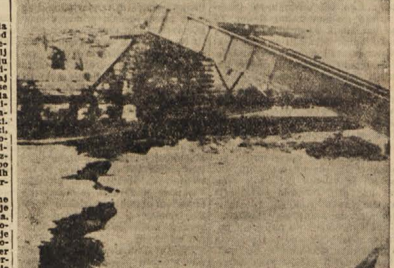
V neurju, ki je te dni divjalo na Irskem, so nalivi v Dublinu izpodkopali in porušili tudi most na železniški progi

VZHODNA NEMCIJA REGISTRACIJA VOJNIH UJETNIKOV Berlin, 12. dec. (Reuter). Die Welt am Sonntag poroča, da so začeli v Vzhodni Nemčiji registrirati vojaške obveznike od 17. do 22. leta starosti in vse bivše vojaške do starosti 46 let. Vzhodnonemška vlada je pred dnevi napovedala, da bo organizirala redno vojsko, če bodo pariški sporazumi ratificirani.