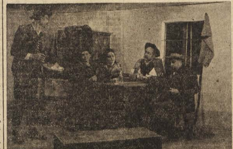
Prizor iz igre »Dve neveste«. Razen marsikaterega ljudskega odra, jo je uprizorilo tudi Okrajno gledališče v Ptuju

bo igralska skupina nastudirala prihodnje leto štiri igre. Upajo, da bodo prihodnje leto, ko se bodo spet sestali na občnem zboru, lahko kaj več poročali o svojem delu.