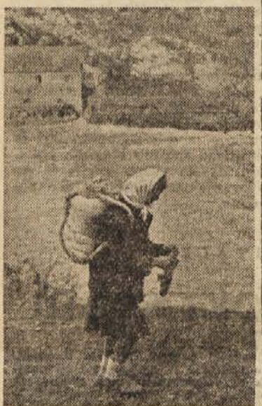
Belokranjka nese v mlin

V Crnomlju je »Agrotehnik« iz Ljubljane razstavila kmetijske stroje. Ogledalo si jih je okrog 4500 ljudi. Kmet iz okolice se je pred dnevi ustavlil pred razstavljenim »električnim pastirjem«: žica, ki jo napelješ