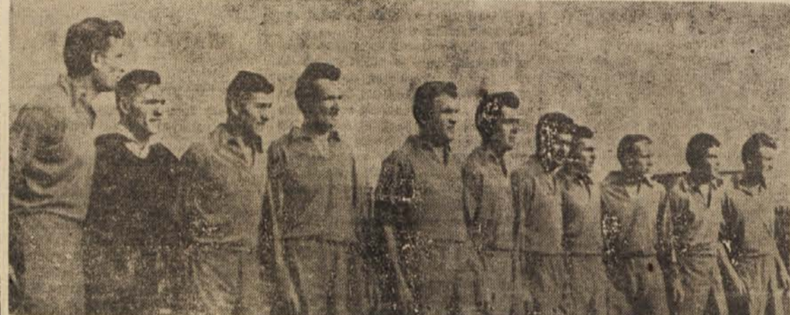
Moštvo državnega prvaka Dinamo iz Zagreba

Dinamo se je danes zavedal važnosti zadnje prvenstvene tekme v letošnjem letu. Njegovi igralci so igrali zelo borbeno in postrvovalno. V zadnjih ostri, pravi prvenstveni borbi je Dinamo zaslužen premagal Spartak. Zagrebški splovil so v celoti dobro igrali. To velja zlasti za krišsko vrsto. Napad je v polju igral zelo dobro, toda pred vrsti se ni znal. Spartak je v glavnem igral podrejeno vlogo, čeprav so bili njegovi napadi kdaj pa kdaj nevarni.