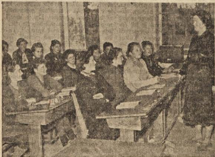
Dekleta v gospodinjski šoli v Gradacu

mika voz; vanj sta vprežena družno vol in konj, in zdi se, da sta drug drugemu v napotje. Ob cesti je raztreseno redko drevje in grmičevje. Lepa je ta deželica, toda revna, da ne more dobro preživeti vseh svojih ljudi. Ta teden jo proučujejo kme-