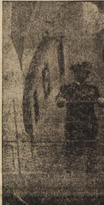
Predsednik republike maršal Tito na krovu »Galeba«

New Delhi, 12. dec. (Tanjug). Delhijski tisk objavlja danes odlomke iz življenja predsednika Tita in obširne članke o Jugo- slaviji. Tako posveča »Times of India« skoraj celo stran pred- sedniku Titu. Časnik piše o vlogi jugoslovanskega predsednika pri organiziranju sindikalnega gibanja, armade in vodstvu ju- goslovanske politike. »Tito je,« zaključuje list, »spretno vodil de- želo skozi burne čase mednarod- nih dogodkov. Pokazal je svetu, da socializem obsega demokracijo, svobodo in človeške pravice in da je politika mirnega obrav- navanja problemov možna.« Tudi revija indijskega Sveta za mednarodna vprašanja »Med- narodna politika« je posvetila svojo zadnjo številko obravnavi jugoslovanske stvarnosti.