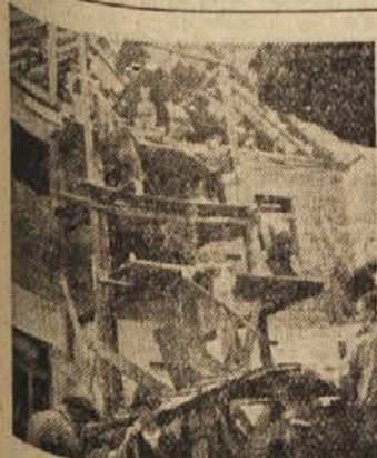
Frostovoljci pri gradnji šole v Nevljah pri Kamniku

Mestna občina Ormož se je potrudila, da je mestno kinopodjetje dobilo nove kinoaparature iz tovarne Iskra. Sedaj imajo lahko predstave vsako soboto in nedeljo. Ljudje lahko gledajo tako dva filma na teden. Novo kinoaparaturu pa je LO MO Ormož podaril KUD »Simon Gregorčič« pri Veliki Nedelji.