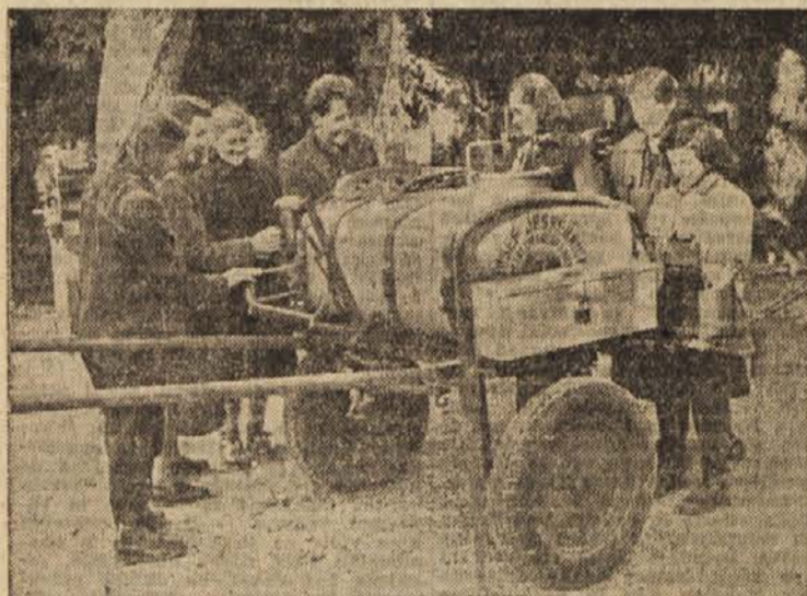
Na razstavi »Agrotehnik« v Črnomlju je vedno živahno

vsaka hiša je spomenik ljudske borbe proti okupatorju.