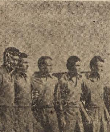
Moštvo državnega prvaka Dinamo iz Zagreba

Ljubljana, 12. decembra Na današnjem zboru slovenskih planinskih markacistov sta bili glavni temi: nove organizacijske oblike in slovenska planinska tranzverzala. Iz treh avtonivnih referatov je bilo prikazano dosedanje delo markacistov in smernice za bodoče. Ugotovljeno je bilo, da je sedanja organizacijska oblika Komisije za planinska pota mnogo boljše od prejšnje. V sklopu te komisije bo 8 markacistov skupaj, in to za Pohorje, Dolenjsko, Koruško, Primorsko, Savinjsko in Kamniško Alpe, Karavanke, Julijske Alpe in ljubljansko okolico. Na čelu teh bodo vodje skupin, ki bodo morali dobro poznati svoje področje in katerih glavna naloga