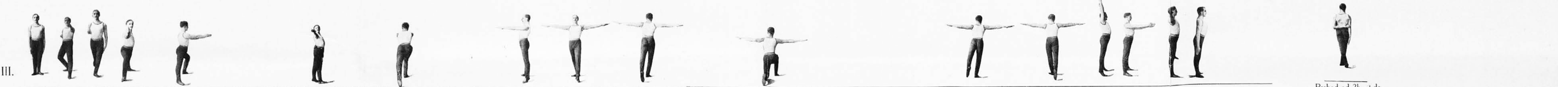
III. Temeljna postava 1a, a, a, β, b, a, b, β, c, a, c, β, d, a, d, β, 2a, a, a, β, b, a, b, β, c, a, c, β, d, a, d, β, 3a, a, a, β, b, a, b, β, c, a, c, β, d, a, d, β, 4a, a, a, β, b, a, b, β, c, a, c, β, d, a, d, β, Prehod od 2b, β do 2c, a, (Začetni na 'in')