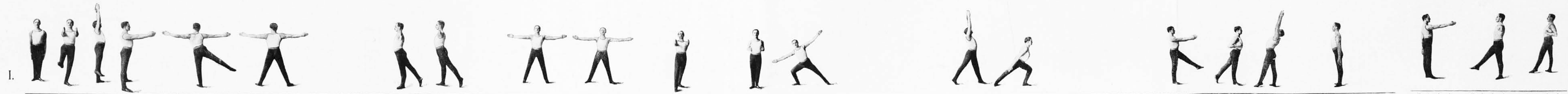
I. Temeljna postava 1a, a, a, β, b, a, b, β, c, a, c, β, d, a, d, β, 2a, a, a, β, b, a, b, β, c, a, c, β, d, a, d, β, 3a, a, a, β, b, a, b, β, c, a, c, β, d, a, d, β, 4a, a, a, β, b, a, b, β, c, a, c, β, d, a, d, β, Prehod od 1b, a do 1b, β, 1d, β do 2a, a, 4a, β do 4b, a.