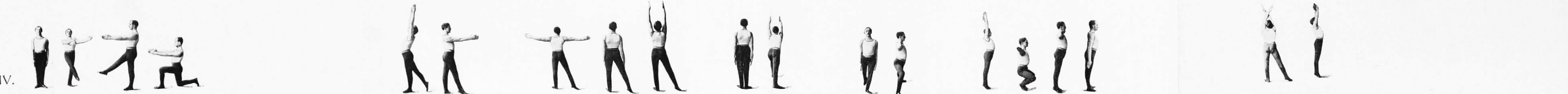
IV. Temeljna postava 1a, a, a, β, b, a, b, β, c, a, c, β, d, a, d, β, 2a, a, a, β, b, a, b, β, c, a, c, β, d, a, d, β, 3a, a, a, β, b, a, b, β, c, a, c, β, d, a, d, β, 4a, a, a, β, b, a, b, β, c, a, c, β, d, a, d, β, Prehod od 2b, a do 2b, β, 3d, β do 4a, a, Prehod od 3d, β do 4a, a.