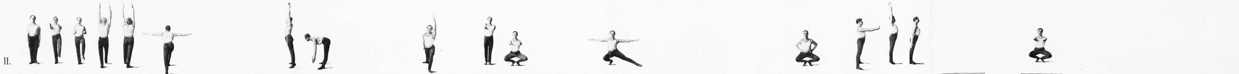
II. Temeljna postava 1a, a, a, β, b, a, b, β, c, a, c, β, d, a, d, β, 2a, a, a, β, b, a, b, β, c, a, c, β, d, a, d, β, 3a, a, a, β, b, a, b, β, c, a, c, β, d, a, d, β, 4a, a, a, β, b, a, b, β, c, a, c, β, d, a, d, β, Prehod v hrbtni položaj rok takoj izpočetka giba do 3c, a.