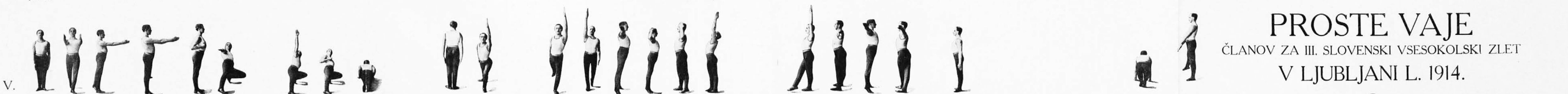
V. Temeljna postava 1a, a, a, β, b, a, b, β, c, a, c, β, d, a, d, β, 2a, a, a, β, b, a, b, β, c, a, c, β, d, a, d, β, 3a, a, a, β, b, a, b, β, c, a, c, β, d, a, d, β, 4a, a, a, β, b, a, b, β, c, a, c, β, d, a, d, β, Prehod od 2b, a do 2b, β, 3d, a do 3d, β, Prehod od 2b, a do 2b, β, 3d, a do 3d, β.

PROSTE VAJE ČLANOV ZA III. SLOVENSKI VSESOKOLSKI ZLET V LJUBLJANI L. 1914.