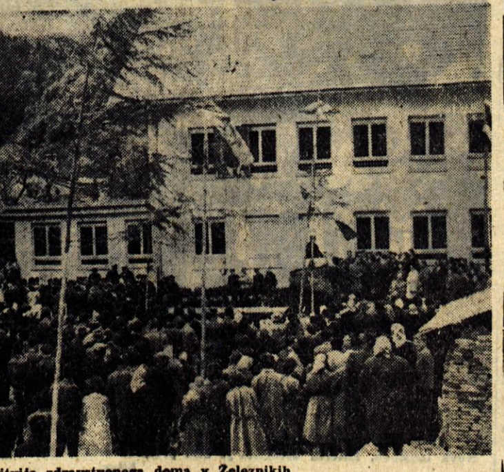
Med otvoritvijo zdravstvenega doma v Zeleznikih

V nedeljo, 7. maja, bo v Kranju okrajna konferenca organizacij Zveze borcev, na katero je povabljenih 120 delegatov in številni gostje. Zadnja okrajna konferenca je bila februarja 1958. letu. V letošnjem obračunu po treh letih dela hočejo zlasti pregledati kako organizacije ZB skrbijo za življenjske razmere preživelih borcev. Letošnja konferenca ima še posebno obeležje spričo 20-letnice revolucije in priprav na kongres ZB Jugoslavije, ki bo letos konec junija.