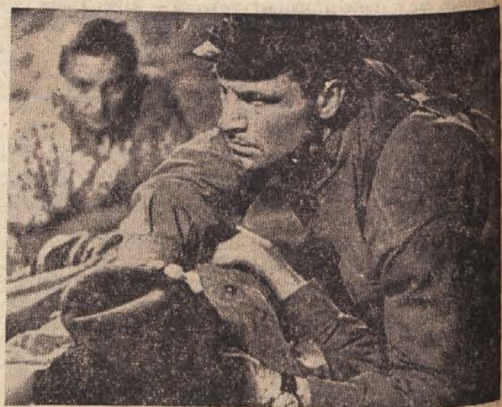
Prizor iz filma »Trinajstletna«