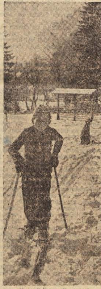
»Prijatelji me čakajo!«

Očetu se zjasni trudni obraz. Poboža sina po laseh,