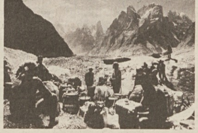
Končala se je današnja etapa približevanja h goram