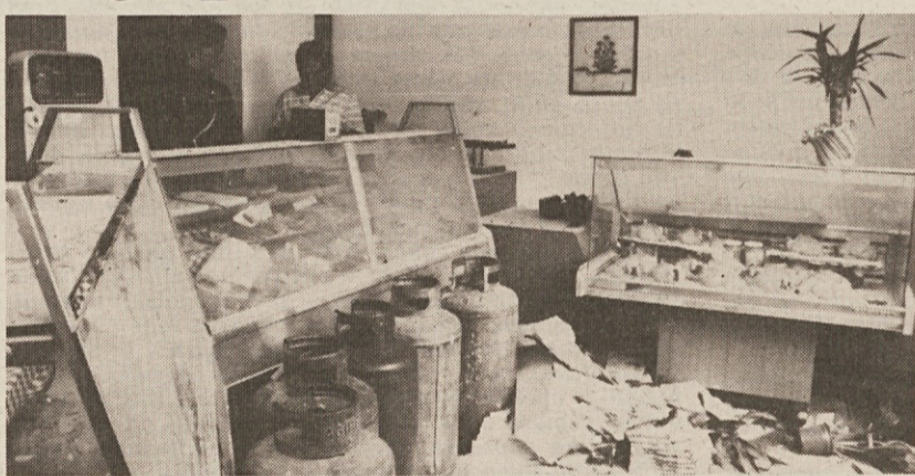
Notranjost trgovine La Gastronomia