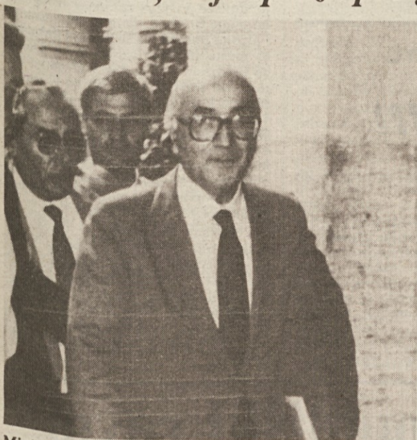
Minister Gava je bil odločno na Meljevi strani (AP)

V dokumentu, ki je bil odobren z večino glasov, tudi kritika sodnika Borsellina, ki je sprožil poseg predsednika republike - Danes razprava v senatu