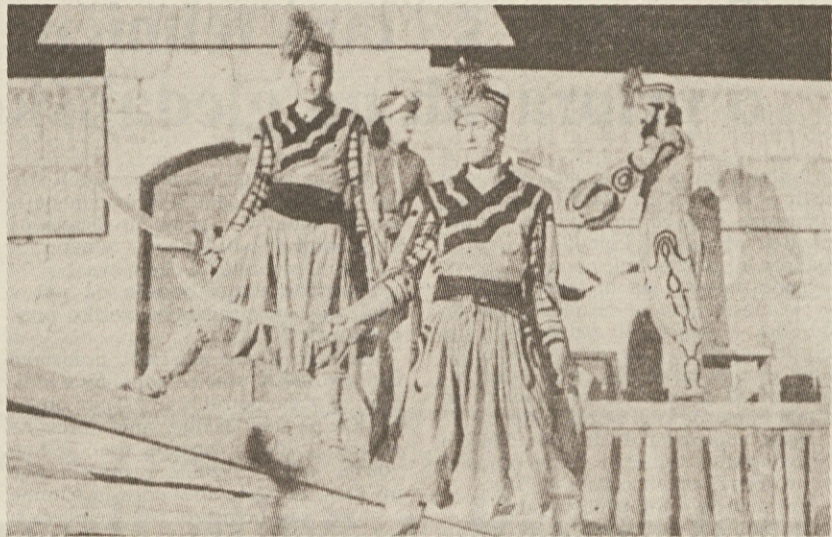
Posnetka s prireditve, ki so bile lani v Svatnah na Koroškem