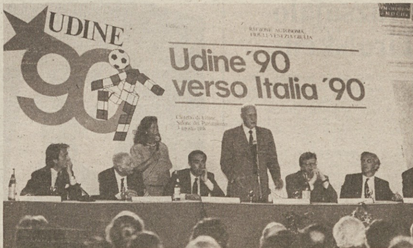
Predsednik FIFA Havelange je te dni obiskal Trst in Videm, kjer so ga seznanili s potekom priprav na svetovno nogometno prvenstvo