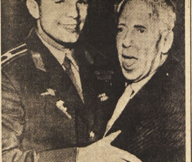
Jurij Gagarin je na svojem potovanju po deželah Latinske Amerike, kamor je prišel iz Londona, prispel v Brazilijo, kjer so ga prav tako navdušeno sprejeli.

Ko so pred obilnimi štirimi leti Sovjeti pognali okoli Zemlje svoj prvi umetni satelit, se je na Zahodu oglašilo vedno bolj onih, ki so Sovjetom očitali, da so preveč tajinstveni, ker da bi bili morali vsaj določeni znanstvenim inštitutom vnajprej sporočiti vsaj valovno dolžino radioodbojnika na umetnem satelitu, ter je kako drugo podrobno, ki bi znanstvenikom na Zahodu omogočila kontrolirati delovanje satelita. Sovjeti so v začetku na to izpade molčali, nato je neki sovjetski znanstvenik v nekem intervjuju le mimogrede omenil, da bi bili ameriški strokovnjaki o sovjetskem satelitu zvedeli že dovolj pravočasno, če bi bili sledili sovjetskim strokovnim revijam. In tedaj so se v za-