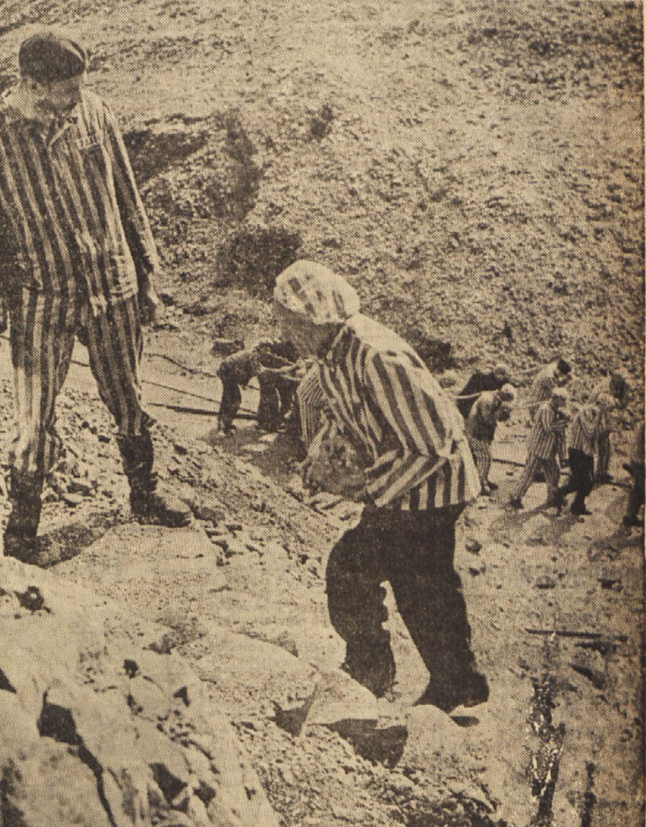
Prizor iz filma «Ograda», ki je bil izdelan v koprodukciji med slovenskim filmskim podjetjem «Triglav» films in nekimi francoskim podjetjem, režiral pa ga je Armando Gatti