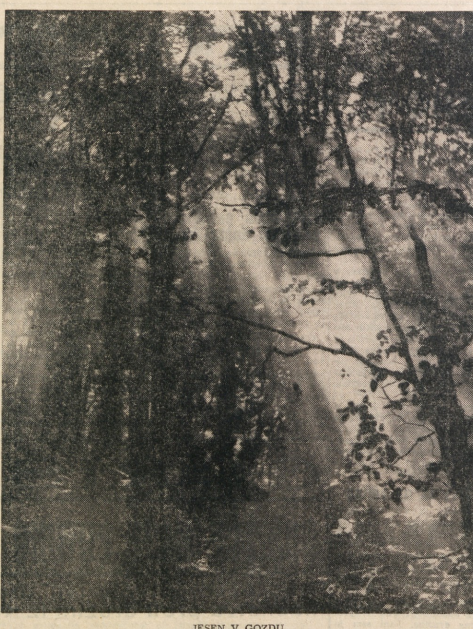
JESEN V GOZDU.

Riž letošnje letine: najnižja cena pridelovalcem 5000 lir za stot navadne kakovosti, 5300 za boljšo in 5600 za najboljšo. Cena žitu, domačemu in uvoženemu, je določena na 7750 lir za stot, z veljavnostjo od 1. oktobra t. l. naprej, blago „alla rinfusa“ zbiralno skladišče za domači pridelalec in za uvoženi: „alla rinfusa“ franko silos pristanišče ali franko notranja skladišča za inozemsko žito, prevoz po železnici v breme kupcev. Pristojbine za SEPRAL in UNSEA niso vštete.