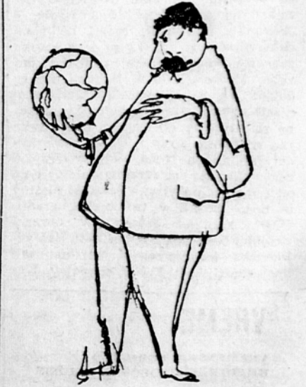
Tako dolgo ne bo miru, dokler ne bova ostala sama v svetovju! (Po »Kerempuhju«)