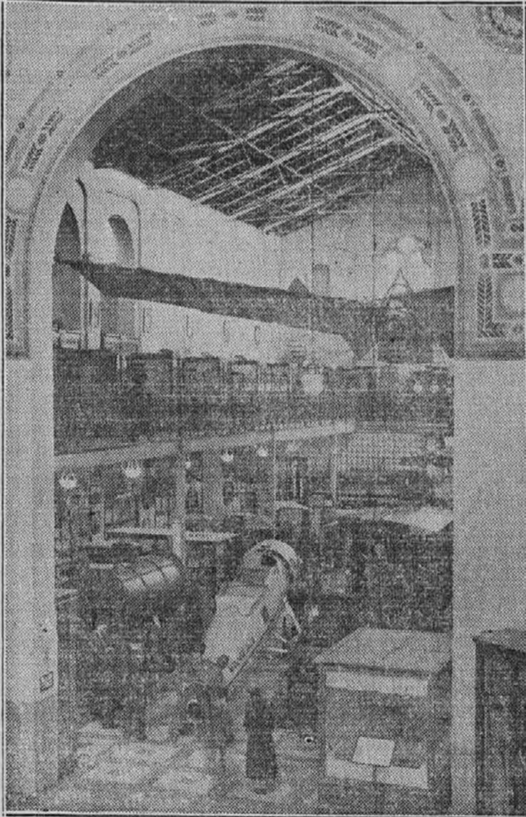
Aeroplan "Winnie May", s katerim je slavni letalec Wiley Post obkrožil zemeljsko oblo in s katerim se je končno tudi ubil v Alaski skupno s filmskim igralcem Will Rogersom, je našlo prostor, kjer bo ohranjeno zgodovini. Gorinja slika ga kaže, ko ga delavci vozijo v muzej Smithsonian Institution v Washingtonu, kjer zdaj visi poleg Lindberghovega letala "Spirit of St. Louis".