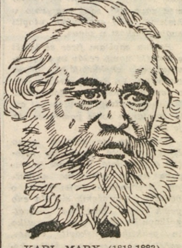
KARL MARX (1818-1883) Je leta 1847 dobil nalogo od prve mednarodne organizacije proletariata »Zveza komunistov«, da skupno z Engelsom sestavi program zveze Manifest komunistične partije.