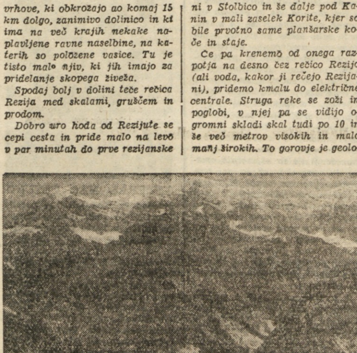
KORITO V REZIJU

ni v Stolbico in še dalje pod Karnin v mali zaselek Korite, kjer so bile prvotno same planšarske koče in stajne. Ce pa krenemo od onoga razpotja na desno čez rečico Rezijo (ali voda, kakor ji rečejo Rezijani), pridemo kmalu do električne centrale. Struga reke se zoži in poglubi, v njej pa se vidijo ogromni skalni skali tudi po 10 in še več metrov visokih in malo manj širokih. To gorovje je geolo-