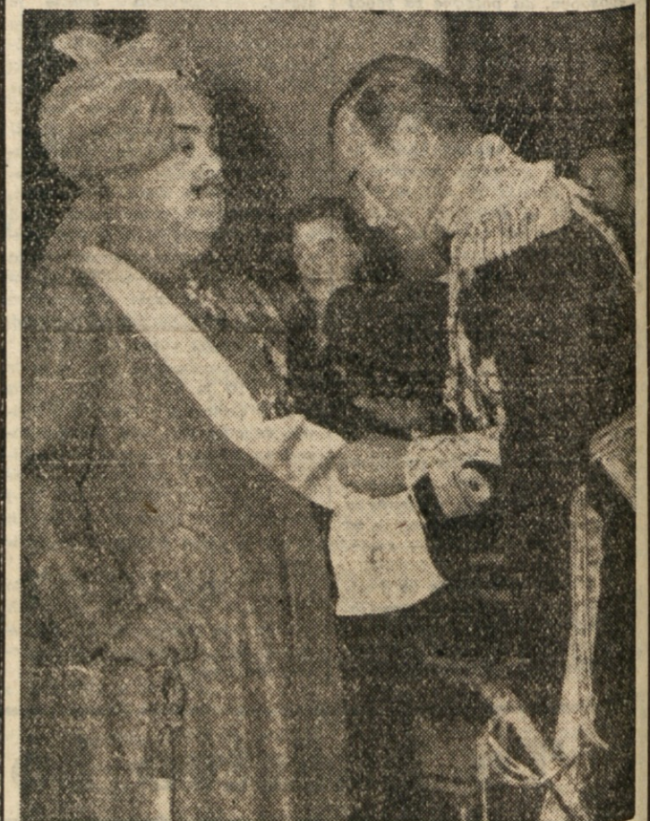
GENERALNI GUVERNER INDIJE ANGLEZ LORD MOUNTBATTEN NA OBISKU PRI MAHARADZI, OB TEJ PRILIKI JE LORD UZROČIL MAHARADZI ODLIKOVANJE »RED INDIJSKE ZVEZDE«. BURKEZ IN GOSPODAR SI PODAJATA ROKI, MEDTEM KO INDIJSKO Ljudstvo STRADA NA RAČUN LUTKE ANGLEŠKEGA IMPERIALIZMA