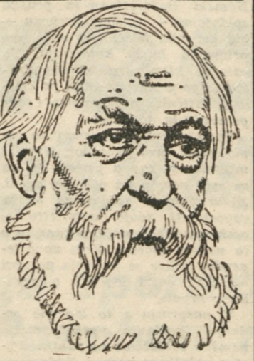
FRIEDRICH ENGELS (1820-1895) Je že leta 1890 napisal, da je Manifest komunistične partije postal najbolj razširjeno, najbolj internacionalno delo vse socialistične literature, splošni program številnih milijonov delavcev vseh dežel.