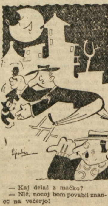
— Kaj delaš z mačko? — Nič, nočoj bom povabili znanec na večerjo!