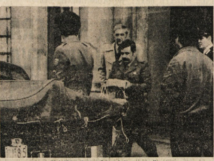
Vojaški miner odstranjuje razstrelivo

Poslonje v Ul. Diaz, kjer so včeraj zjutraj našli petardi, je last za-vovalnice Lloyd Adriatico, v njem pa so izključno uradi raznih tvrdk in podjetij. Prvo petardo je odkrila okrog 8.15 uroženka nekega podjetja, ki ima uradno v prvem nadstropju poslopja. «Ko sem prišla v službo - je povedala pozneje še dva prestrašena, sem že v vhodu slišala sumljivo tik-takanje, za kaj vse pa sem ugotovila šele na vrhu stopnic, ko sem pred vrati CIET ozavila kovinsko skatlo, iz katere so molele žice povezane z buidliko, na zidu pa velik rdeč napis. Ne