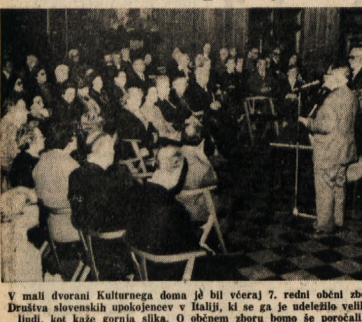
V mali dvorani Kulturnega doma je bil včeraj 7. redni občni zbor Društva slovenskih upokojencev v Italiji, ki se ga je udeležilo veliko ljudi, kot kaže gornja slika. O