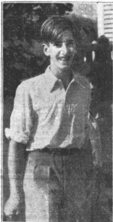
Najnovejša slika ljubljenelega kralja