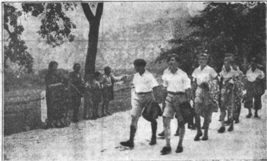
Kralj gre s svojo četico v gorenjsko prirodo.

V ponedeljek 6. t. m. je naš mladi vladar Peter II. dovršil svoje štirinajsto leto in stopa zdaj v mladeniško dobo. Kdor je imel priložnost čuti njegove vzgojitelje, je z zadoščanjem doznal, da se naš mladi vladar duševno in telesno razvija tako, da bo ponos naše lepe domovine in vreden dedič svojega očeta, velikega kralja Zedinitelja. V mladem vladarju se oblikuje nadvse prijazen značaj. Skromen je, resen pri vsakem delu, a vesel in veder v prostem času. Ljubezniv sin svoji materi, srčno dober brat svojima bratcema, hvaležen učencem svojih učiteljev in zvest tovariš tovarišem pri učenju in igri.