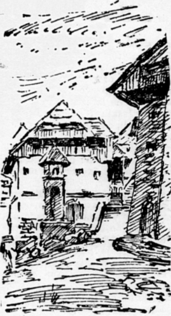
Vsa Kropa je en sam muzej

Zato je vrtanih veliko številno vrtnic, vse polno je vrtnih garnitur in nad njimi se dvigajo jekleni stolpi. Stroji so nabavljani v najrazličnejših deželah. Na oznakah lahko čitamo: Made in USA, Germany, France. Za te stroje smo plačali okoli sedem sto milijonov dinarjev, kar nam bo omogočilo, da bo temna, mastna tekočina neovirano in neprekinjeno prihajala na dan, se zlivala v cisterne in se potem spreminjala v bencin, petrolej... Zaradi tega so pipe na mnogih stolpih čvrsto prileto, toda konec leta se bodo odprle in iz njih bo začela teči tekočina, ki jo je nekaj desetih ljudi vrtajno, včasih tudi v dvomih, iskala štiri dolga leta. L. B.