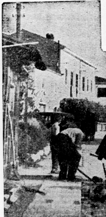
Tako so ob priključitvi lani oktobra podrli probivalci Skoflj mejni blok; večeraj pa se še do 11. ure dopolnilno volili 88 odstotno.