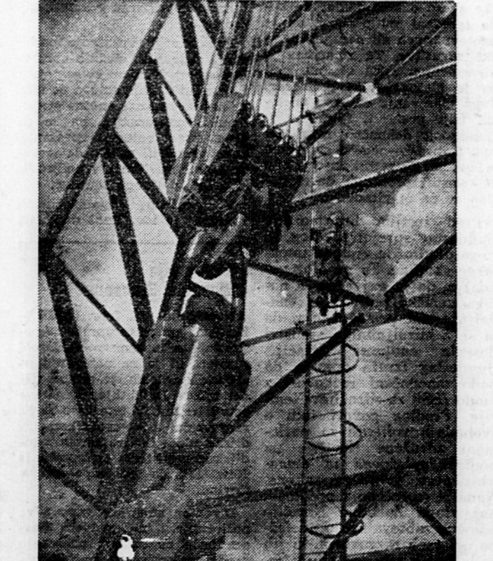
Visoko pod nebo se dviga vrtni stolp...

Rodovitna so vojvodinska polja. Težko je pšenično kvasje, koruzni storž je poln, zato je kruh bel, miza bogato obložena, pa tudi vina ne primanjkuje. Ob taki mizi se rado razvije veselo razpoloženje, šala in smeh. Ena izmed teh je: če zlezeš na bučo, ki je največji hrib v Vojvodini, lahko vidiš Vojvodino z enega konca na drugi. Najvišja točka na tej kakor dlan ravni zemlji je cerkveni stolp.