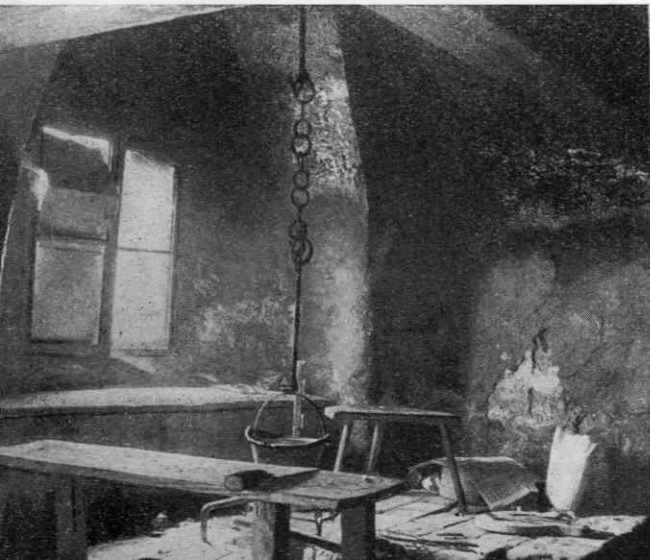
Staro ognjišče v Črnem Kalu

Sodimo, da so bogata nemška posestva na Koroškem in Gornjem Štajerskem že zelo zgodaj pritegovala slovensko delovno moč. Ženske so iskale zaposlitve kot služkinje