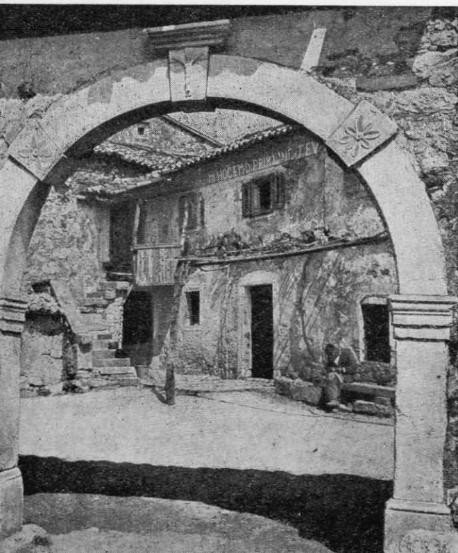
Značilna primorska hiša v vasi Črni Kal

objavljene ob tekstu članka, so bile posnete ob terenskem delu »Kronike« v tržaški okolici oz. Etnografskega muzeja v Brdih.