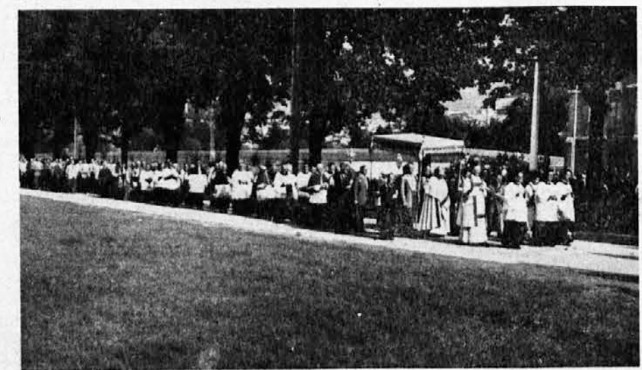
Pogled na lurško procesijo z Najsvetejšim.

Izraelski radio je organiziral nagradno tekmovanje iz svetega pisma. Tekmovanje je bilo prirejeno za 10-letnico obstoja izraelske države. Udeležili so se ga zastopniki petnajstih držav. Celotno prireditev so filmali in morda jo bomo še kdaj videli po televiziji. Prireditve je vzbudila veliko zanimanje za sveto pismo.