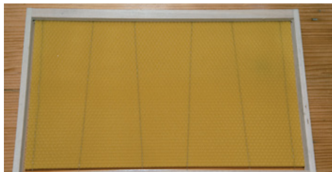
Pravilno zažičena satnica. V ta namen uporabljamo star, še vedno odličen električni zažičevalec iz osemdesetih let.

Eno od opravil, ki zadeva slehernega čebelarja, je žičenje satnikov. Mnogi satnike zbijajo sami, drugi kupujemo že zbite. Pri žičenju je zelo pomembna temperatura prostora, v katerem delamo. V prehladnem so satnice prekrhke in se rade lomijo, zato je priporočljiva najmanj sobna temperatura. Tudi satnice same je pred delom priporočljivo ogreti, da so mehkejše. En dan pred delom postavim karton s satnicami na klop ob krušni peči, zaradi česar satnice pri delu niso nikoli krhke. Satnike z vtaženimi satnicami shranjujemo do uporabe tako, kot bodo stali v panjih, da se satnice do takrat ne ukrivijo in povesijo.