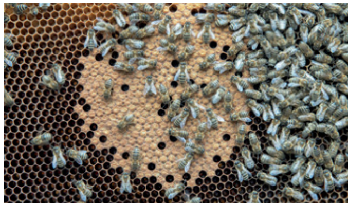
Na začetku februarja zaplate zalege obsegajo približno za dlan površine. Na fotografiji je odlično zaležen sat, vendar brez venca medu. Družini sem pomagal z dodajanjem krme.

Čistilni izlet, zlasti prvi v letu, je tehten razlog, da čebelar obesi na klin vsa druga opravila v hiši in se posveti izključno opazovanju čebel in razbiranju njihovih sporočil, kajti na to je čakal celo zimo. Pri tem se osredotočimo na jakost izletavanja čebel in bodimo pozorni na panje, iz katerih čebele sploh ne izletavajo. Na videz »mrtvi« panji to največkrat niso, kajti različne čebelje družine imajo povsem drugačne potrebe po zgodnjem izletavanju. Vsekakor pa to lahko najlažje preverimo ravno na izletni dan, kajti takrat vladajo pravišnje zunanje temperature, na kar so čebele opozorile kar same. To pomeni, da jih s tem, če bomo za kratek hip odprli vratca panja in rahlo pihnilo vanj, da bi preverili odziv, ne bomo ogrozili. Pihnemo in prisluhne mo lahko preprosteje kar skozi panjsko žrelo. Če se čebele odzovejo z rahlim šumenjem, pač nimajo potrebe po izletavanju, kar je za nas tudi dober podatek. Če odziva ni, je družina v panju preminula. Odprimo ga, odstranimo satje