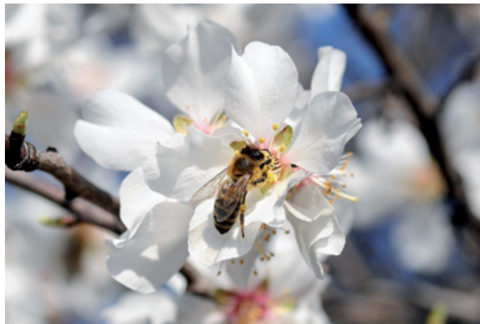
Medtem ko februarja v celinskem, torej večinskem delu države še preštavamo posamezne cvetove teloha, zvončkov in žafrana, na Obali razvavajo čebele dehteči cvetovi mandljevca ( Prunus dulcis ).