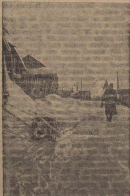
Straße in einer kleineren Stadt im Osten.

Vse vojne, ki so jih pred tisoči let vodili takratni še zaostali narodi, poznejše vojne starih Rimljanov in druge, pa vse do prve svetovne 1914/18, so se v glavnem bile za zadeve, ki jih danes označujemo z besedo »gospodarstvo«. Želja in naravni nagon po človeka dostojnem, lepšem in boljšem, ali vsaj sosedom enakem življenju sta v mednarodnih sporih ali vojnah največkrat