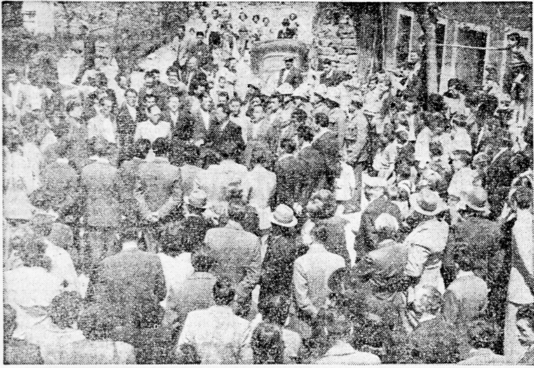
Pevski zbor v Zelenem vrhu je zapel dobrodošlo uslužbencem Univerze