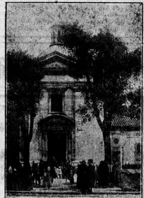
Stoletnica smrti velikega španskega slikarja Goye. (Prva slika je portret po slavni Lopezovi sliki, druga pa rojstna hiša velikega umetnika.)