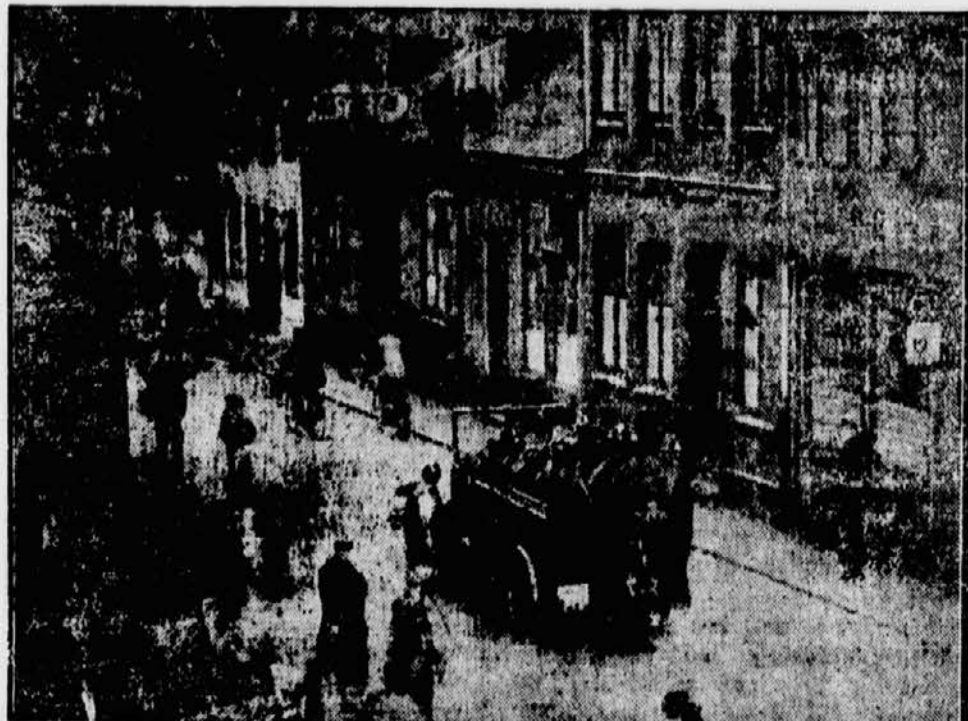
Ein Blick in die Markensstraße (Eds Große Johannisstraße) in Altona, in der der Straßenkampf besonders heftig tobte. Nach den Unruhen stehen die Bewohner lebhaft diskutierend in den Straßen, während immer noch Polizeiwagen die Unruhegegend abfahren.