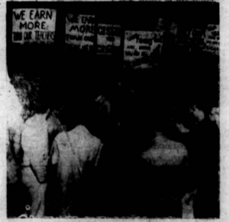
Dijaki s napiši pred Coynovo šolo v Chicagu sahtevalo višje plače za učitelje. Ti dijaki so bivši vojaki, ki študirajo na elek-trični šoli. Učitelji in inštruktorji so člani učiteljske unije CIO.

1) Amendiral Taft-Hartleyev zakon ali pa ga nadomestil z no-