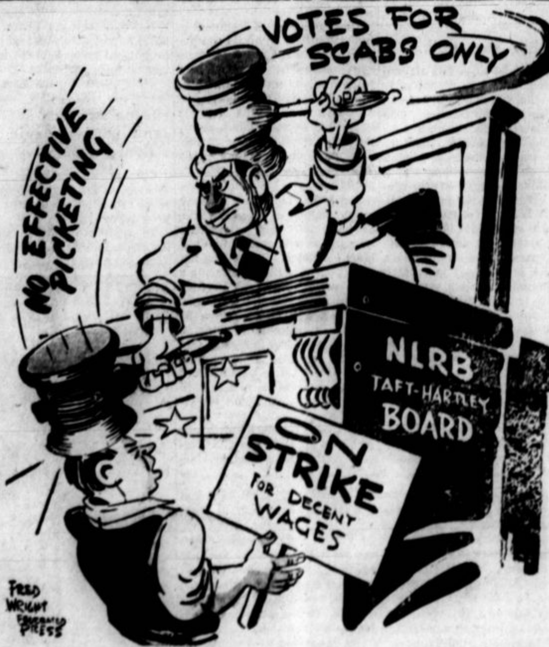
Uradnik Taft-Hartleyevega protidelavskega zakona bje s kladivom po glavi stavkajočega delavca, s drugo roko pa vili kladivo s napisom, da le stavkocaki smejo voliti.

Sofija (ALN).—V Bolgariji se proizvodnja hitro zvišuje, zato so bile reducirane cene 18 različnim predmetom in potrebščinam, med temi so svila, preprog, papir, les in baker. V kratkem bodo znižane cene še drugim izdelkom.