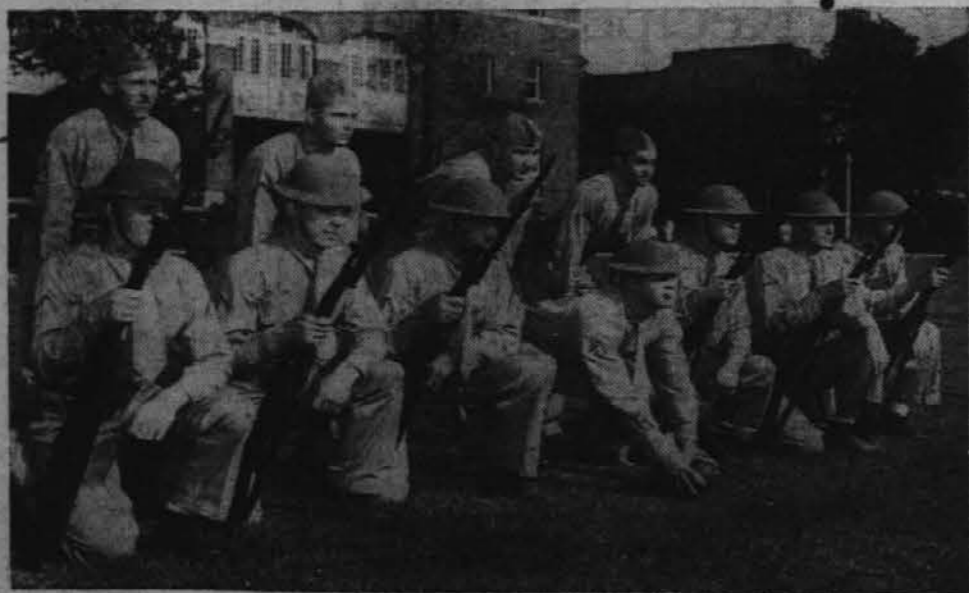
Avstralski vojaki se izkreujejo v Singapuru, da se pridružijo ostali angleški armadi na Malajskih otokih.