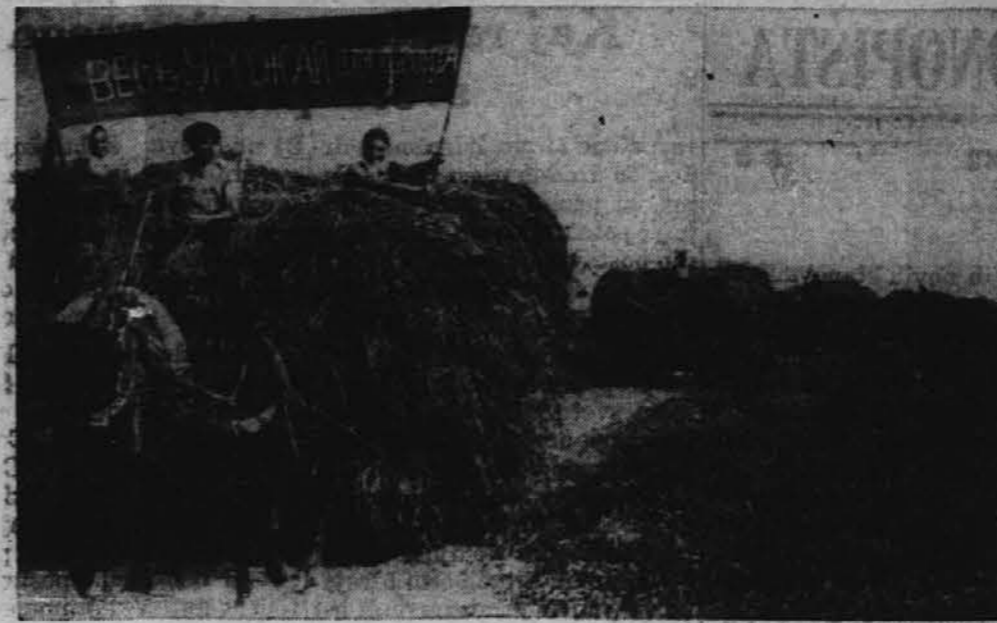
Ruski kmetje na kolektivnih kmetijah pospravljajo žito za rdečo armado in za civilno prebivalstvo. Le malo žita je padlo Nemcem v roke.