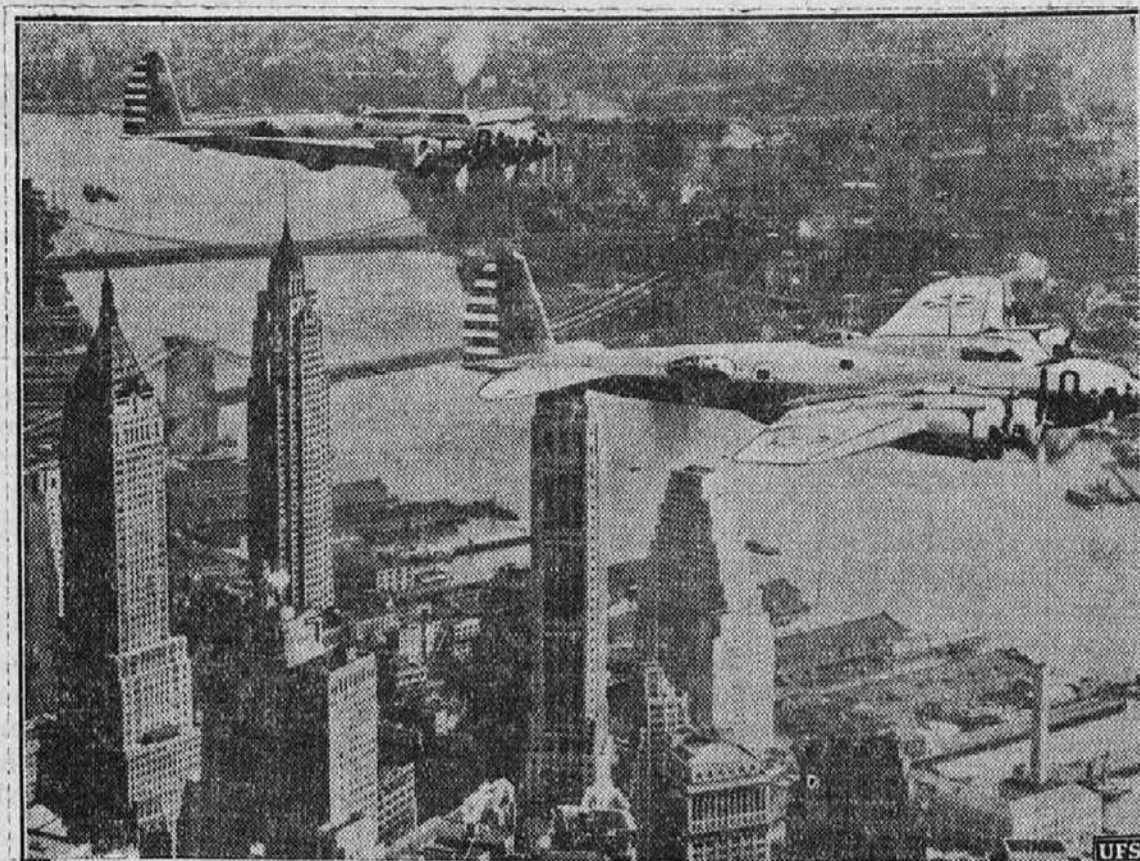
Prerokuje se večje in hitreje aeroplane, take, ki bodo lahko nosili 100 potnikov in leteli 200 milj na uro. Tukaj vidite najnovejše vojaške zrakoplove Zed, držav, ki plovejo nad New Yorkom.