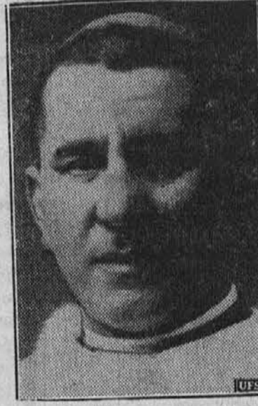
V kratkem bo papež Pij imenoval pet novih kardinalov. Trije od teh so na sliki in sicer: Arthur Hinsley, nadškof iz Westminster, Anglija, Giuseppe Pizzardo, nadškof iz Nice in vatikanski tajnik Giovanni Piazza, beneški patriarh.