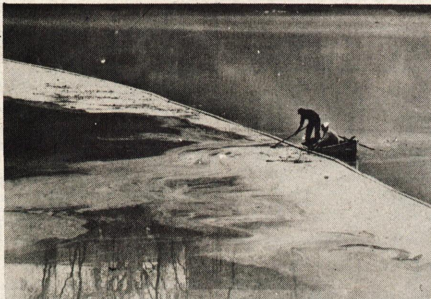
Spet mazut v Savi — V nedeljo, 4. maja, v ranih jutranjih urah je prišlo do okvare v kotlarni Zdravstvenega doma v Kranju. Podobno kot ob nedavnem izlivu mazuta iz kotlarne na Planini so obveščali počasi; slabo so ocenili, koliko mazuta je izteklo, saj so sprva govorili le o 300 do 500 litrih mazuta, zdaj pa kaže, da gre za desetkrat večje količine. Mazut je onesnažil Savo do jezua mavčiške elektrarne. Hitro pa so po obvestilu, ki so ga dobili šele po 12. uri, ukrepali delavci Vodnogospodarskega podjetja iz Kranja, ki so v nedeljo popoldne v kanalu vodne elektrarne v Majdičevem logu pobrali tono mazuta. V Prašah so čez Savo položili baražo, s pomočjo katere pobirajo mazut iz reke. (Več na zadnji strani)