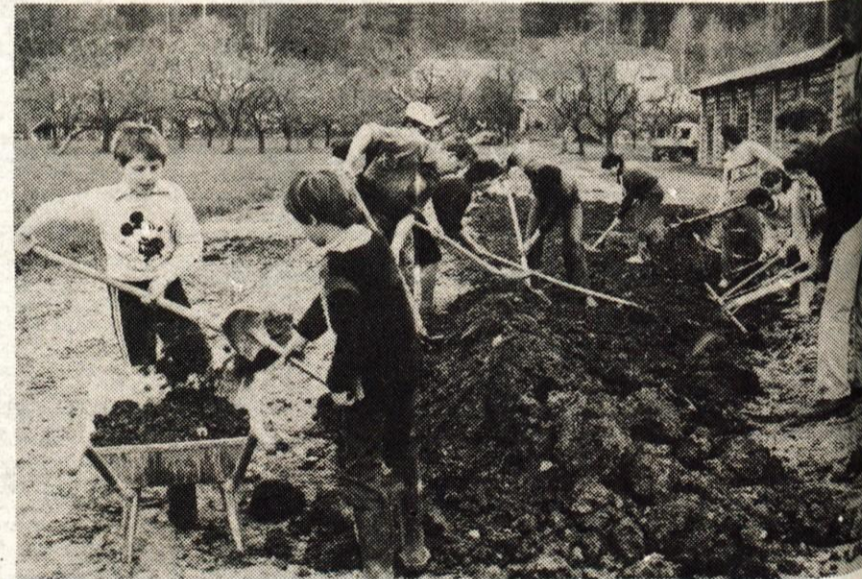
Podbrezje, aprila — Prebivalci zaselka Srednja vas v krajevni skupnosti Pod- brezje so pred prvomajskimi prazniki s prostovoljnimi delom izravnali zemljiš- če, kjer so lani vgradili cevovod za od- vodnjavanje meteornih voda. Mladi in starejši so zavihali rokave in po ugre- zninah razgrnili navoženo zemljo, da bodo na njej spet lahko zasejali travo. Sedaj je zgrajen le glavni vod, zato si bodo v gradbenem odboru prizadevali, kot so povedali njegovi člani, za pridobi- tev potrebnega denarja in za gradnjo razvodov s priključki nanj. (S)

Predstavnik Vodnogospodarskega podjetja iz Kranja je povedal, da so obvestilo o nesreči dobili pozno, šele po 12. uri, tudi ocena, da je izteklo le 300 do 500 litrov mazuta, ni bila pravilna, saj zdaj ugotavlja- jo, da ga je izteklo desetkrat več. Če bi bilo obveščanje pravočasno in pravilno, bi bilo onesnaženje Save znatno manjše, saj bi mazut lahko ustavili in ga več pobrali v energetskem kanalu vodne elektrarne v Majdičevem logu. V nedeljo popoldne so tam pobrali pet sodov strjene- ga mazuta, v Prašah pa so čez reko položili baražo, s pomočjo katere iz reke pobirajo mazut. Včeraj so čiščenje nadaljevali, na pomoč pa so poklicali posebno ekipo Hidro podjetja iz Kopa, saj je Savina voda to- plejša in na gladini nastaja emulzijski film. M. Volčjak