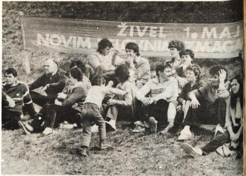
Prvi maj slavi že stoletnico — 1. maja 1886. leta je začelo v Chicagu stavkati 40 tisoč delavcev za izboljšanje delovnih razmer in za skrajšanje delovnega časa. Takrat je trajal še po 14 ur na dan. Tri leta kasneje je bil na ustanovnem kongresu II. Internacionale v Parizu v spomin na čikaške žrtve prvi maj razglašen za mednarodni delavski praznik. 1890. leta so ga delavci prvič praznovali. Še pred zadnjo vojno so ga naši delavci praznovali skrivaj, vsa povojna leta pa je to resnični praznik vseh naših ljudi. Na sliki: Kranjčani so se tudi letos zbrali na Joštu.

Prijetno srečanje se je končalo s pla- ninskim plesom in ob igranju Šaleške- ga instrumentalnega kvinteta so naši delavci, zaposleni v Zürichu in okolici, obljubili: »Nasvidenje poletu na Trigla- vul!« C. Zaplotnik