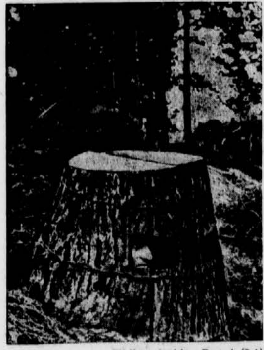
PK-Kriegsberichtler Poetsch (Sch)

»Die Sowjets rechneten nach dem Überraschungsangriff der ersten Nacht natürlich mit einer Wiederholung unseres Besuches. Sogar eine Art Geleitschutz hatten sie eingerichtet. Wir kamen aus der Höhe von Stalingrad, wo wir im Nebenabschnitt weithin einen brennenden Tanker leuchten sahen, und flogen nach Süden. Da trafen wir auf mehrere Schiffe, die von einem kleinen Motorboot unermüdlich umkreist wurden. Die