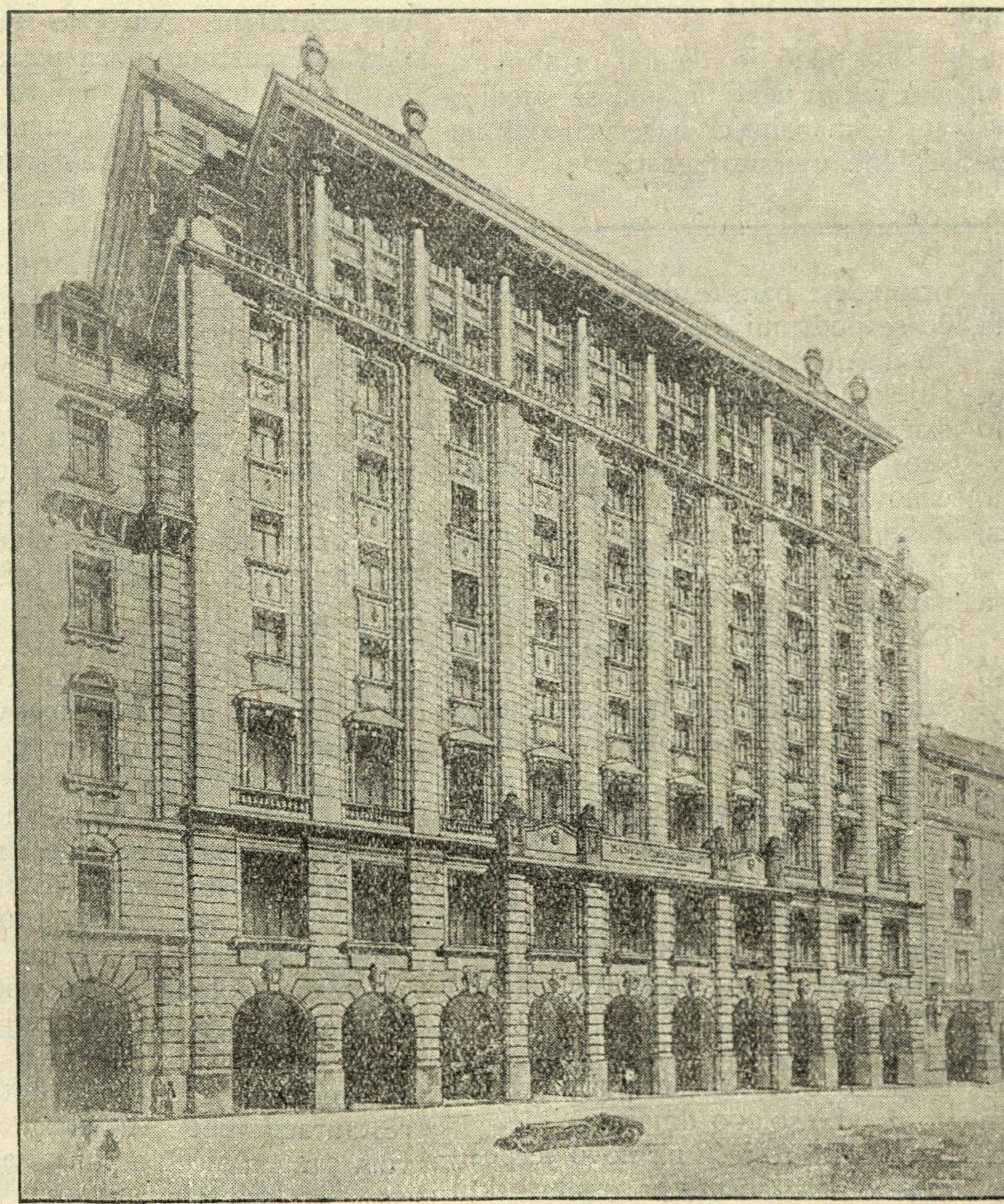
BANCO GERMANICO DE LA AMERICA DEL SUD. Frente a la Av. L. Alem, con la entrada a la Sección Esclava Ulaz v Jugoslovensko Odeljenje.

I MAMO I VEOMA LIJEPE SOBE ZA SPAVANJE. SVOJ SVOME!