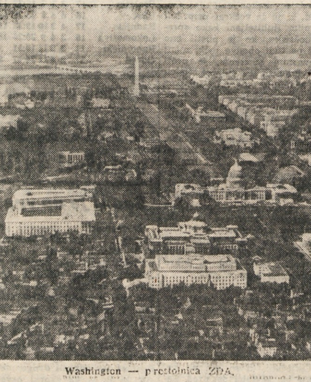
Washington — prestolnica ZDA.

Bil je tudi na čelu družbe, ki je imela v načrtu izkop plovnih prekopov ob reki Potomac, s čimer bi se povezovala porečja Oha in Mississippija z morskim zalivom Chesapeake.