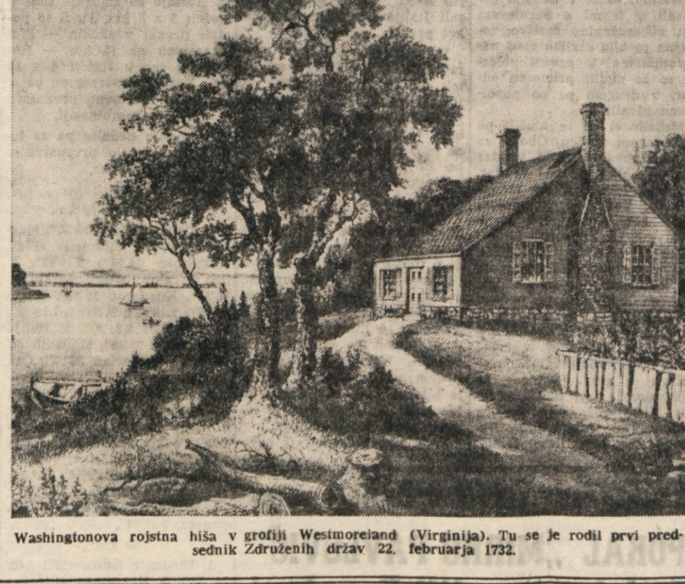
Washingtonova rojstna hiša v grofiji Westmoreland (Virginija). Tu se je rodil prvi predsednik Združenih držav 22. februarja 1732.

Kraj, kjer stoji danes prestolnica Združenih držav — ki se imenuje po njem — je izbral on; Washington, takrat predsednik Združenih držav, je skupno z arhitekti izdelal načrt za novo mesto, ki naj bi po njegovi zamisli imelo podoben razvoj kot velike evropske prestolnice. Ameriška prestolnica ima še zdaj, 150 let po svoji ustanovitvi, s svojimi širokimi dvoredni in razsežnimi trgi sledove zamisli svojega ustanovitelja.