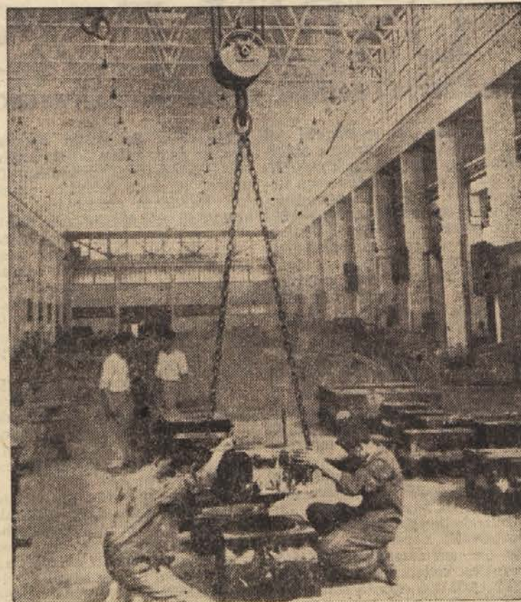
V modelarskem oddelku »Litostroja«

Drugo vprašanje, ki ga bo treba urediti, je, kako zagotoviti primerne prejemke tistim starejšim delavcem, ki so fizično že izčrpani in ne dosegajo več takega delovnega učinka kot mladi. Nedvomno je treba tudi to vprašanje primerno urediti. V Litostroju so sklenili, naj bi tistim delavcem, ki so že dolgo zaposleni v Litostroju, določili neke vrste dodatek za stalnost. S tem pa seveda to vprašanje še ni v celoti urejeno. Praksa bo pokazala, kje in kaj bo treba v premijskem pravilniku še spremeniti in popraviti. M. G.