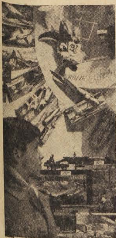
Te dni obdarujejo v Zahodni Nemčiji otroke. Kakšen vzgojni duh veje letos ondod, kaže slika izložbenega okna neke trgovine v Münchenu, kjer so pod geslom verskega praznika razstavljeni sami jedrski bombniki, medkontinentalne rakete, tanki na električni pogon in podobne »igračke«