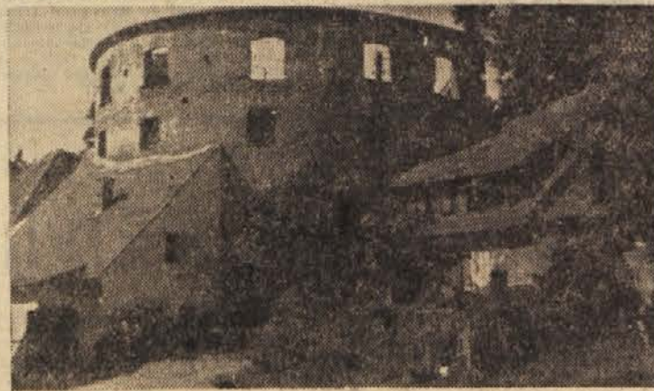
Stolp na Lentu bo letos spremenil svojo podobo

Za ureditev starega dela mesta so ustanovili posebno komisijo, ki bo vodila vsa dela in skrbelo za potrebna gmotna sredstva. J. P.