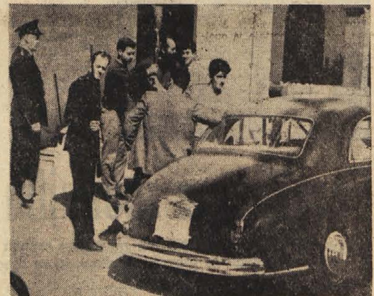
Zadnje dni je ciprsko krajevna policija med pripadniki EOKA zbirala orožje. Zbrali so 613 pušk in strojnico, 17.000 nabojev, 2000 bomb in malone eno tona razstreliva. Na sliki oddajanje orožja nekje blizu Nikozije.

Kartum, 25. marca (AFP). Danes je v Kartumu umrl vodja sudanske Neodvisne stranke »Umma« Abdel Razman el Mahdi. Bil je tudi voditelj verske ločine »Ansara«.