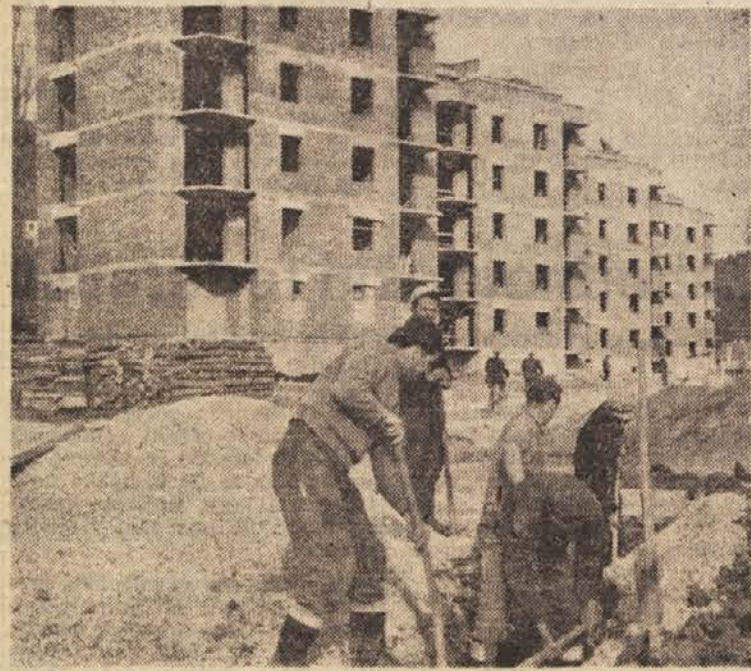
V Velenju naglo napreduje gradnja stanovanjskih poslopij in urejanje komunalnih naprav. Med najlepše zgradbe Novega Velenja lahko nedvomno prištevamo petnadstropne desetorčke

Računajo, da gre v zadnjem času vsaj tretjina odkupljenega vina mimo rednega prometa, pri čemer je skupnost oškodovana na dajatvah samo v Sloveniji za stotine milijonov din. Do takih pojavov ne bi prišlo, če bi redno kontrolirali prevoz vina, ki je po predpisih dopusten le z listinami o plačanem prometnem davku. Vinogradnikom so celo predpisane količine, ki jih od pridelka lahko sami potrošijo brez prometnega davka. Kaže pa, da tudi tu ni kontrole, sicer se ne bi tako razpasla prodaja pod roko. Vsi ti pojavi nujno terjajo odločne ukrepe in uspešnejšo kontrolo prometa z vinom. F. S.