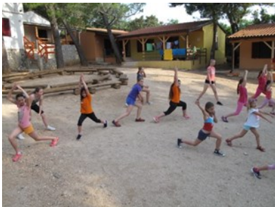
Plesne vaje v Nerezinah.

Z aktivnostmi smo začeli že takoj ob koncu šolskega leta - 25. junija in jih nadaljevali vse do 26. avgusta. Konec junija in v začetku julija smo otroke ajdovske in vipavske občine peljali na dve letovanji v Nerezine, kjer so letovali v naselju ZPM Krško, tisti, ki pa so ostali doma, so se udeležili delavnic in varstva v Hiši mladih. Poleg ustvarjalnic smo pripravili tudi plesne delavnice breakdanca in hip hopa ter fotografske delavnice.