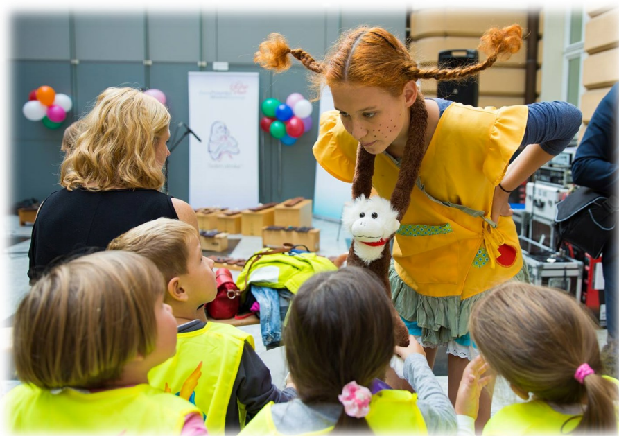
Obisk Pike Nogavičke na uvodnem dogodku v Teden otroka.