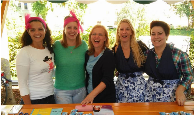
Nasmejane ZPM-jevke na festivalu LUPA.

ZPMS in nekaj njenih članic (ZPM Ljubljana Vič Rudnik, ZPM Ljubljana Center in Šiška ter ZPM Ljubljana Moste Polje) je mimoidočim predstavilo svoje aktivnosti na stojnici.