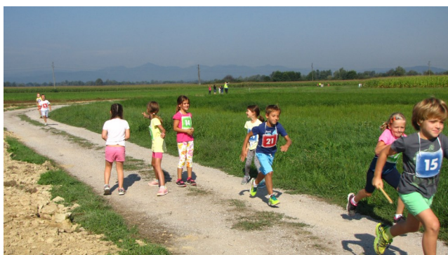
Ko sodelujemo, zmagujemo!

Pripravila: mag. Radmila Pavlovič Blatnik