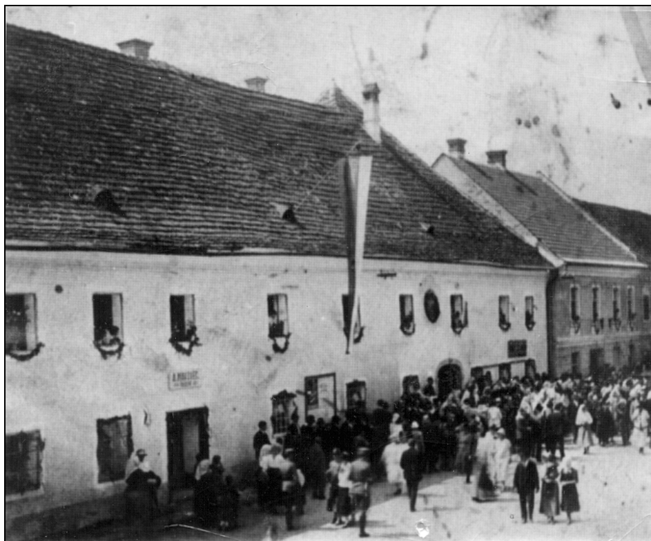
Pekarna Pirtovšek v Dravogradu leta 1925.