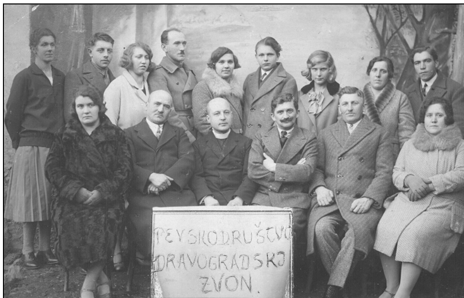
Pevska družba Dravogradske Zvon leta 1929.