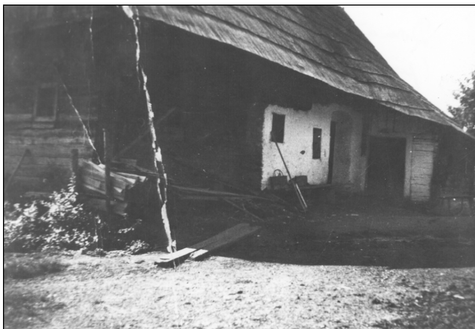
Poltnikova kmetija na Sv. Primožu, preden je pogorela.