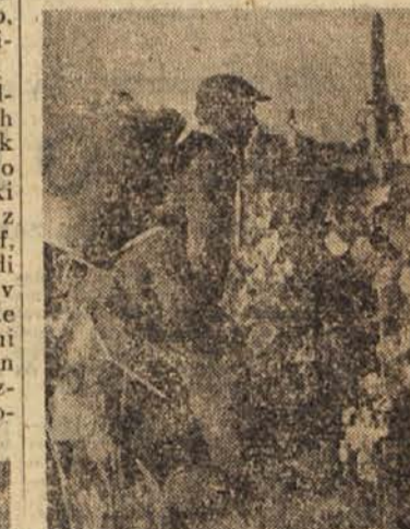
Petdeset kilogramov na rami od jutra do večera gor in dol — to je druga stran idile o trgatvi

»Vsi so se zasmeli. Večer je bil lep, poln prečnega smeha in krepkih kmečkih šal, starih zgodb, plesa in poželjivih pogledov, oprešnega kolača in močnega vonja po moštu in karbidu. Gospodar pa se je ves čas tiho smejal in nosil koš za košem