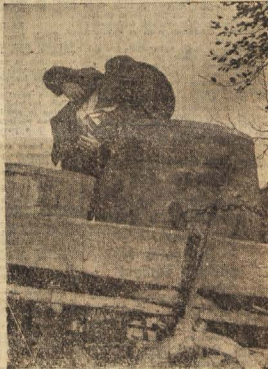
Putarji nosijo polne pute v sode na vozovih, ki jih z volji vozijo v kleti in zidanice, tam pa iztisnejo iz njih zlato-rumeni mošt

»Ej, mati Reza! Do katerega leta pa ste vi tlačili?«