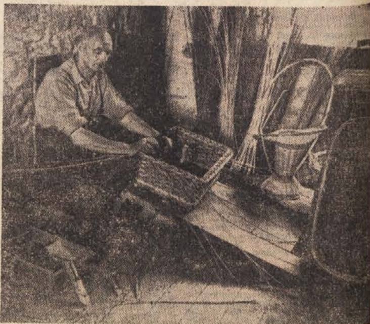
Pletilec košar iz Severnega Lancshira, iz vasi Arkholme, Anglija

Ljudje navadno mislijo, da je Islandija zelo mrzla dežela, dežela večnega ledu in snega. To pa ni res. Podnebje je sicer ostro in padavin mnogo, toda okrog otoka teče Zalivski tok in zato so zime na Islandiji mile. Temperatura pada največ na 10° pod ničlo in sneg zapade v Reykjaviku redko. Razen tega pa je na Islandiji več vročih vrelcev. Vroč vodo so napeljali iz njih tudi 20 do 30 km daleč v Reykjavik, kjer jo uporabljajo v hišah, mesto pa jo uporabljajo za centralno kurjavo. Temperatura vode znaša 30 do 40°.