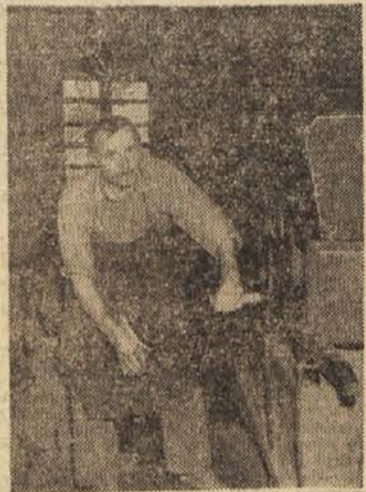
Gospodar je vesel, saj je debrega grozdja mnogo v preši. Kaj zato, če mu znoj zaliva obraz

»Premalo je sladko! Dlan je prekrivala tenka plast oprijemljive sladke sluzi.« Ne gre drugače, začeti bo treba! Pazno se je razgledal po vremenu, nato pa odšel proti hiši, kjer je domačim objavil sklep.