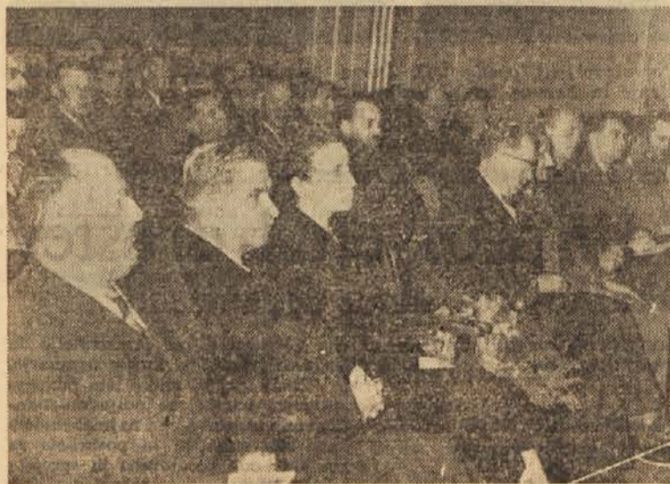
Pogled na del gostov in delegatov

V razpravo o tem vprašanju so posegli tudi drugi advokati.