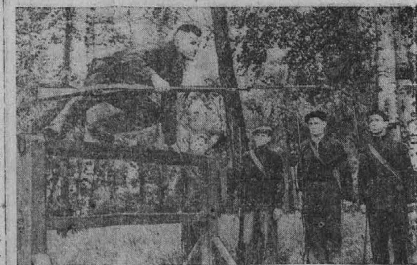
Leningrajska mladina, ki je sicer zaposlena v tovarnah, kjer se izdeluje produkcija za orambo, se vežba v umetnosti bajonet- nega bojevanja. Na sliki vidimo mladeniča, ki gre preko visoke zapreke v napad, dočim ga njegov tovariš gledajo, nakar pridejo tudi oni na vrsto.