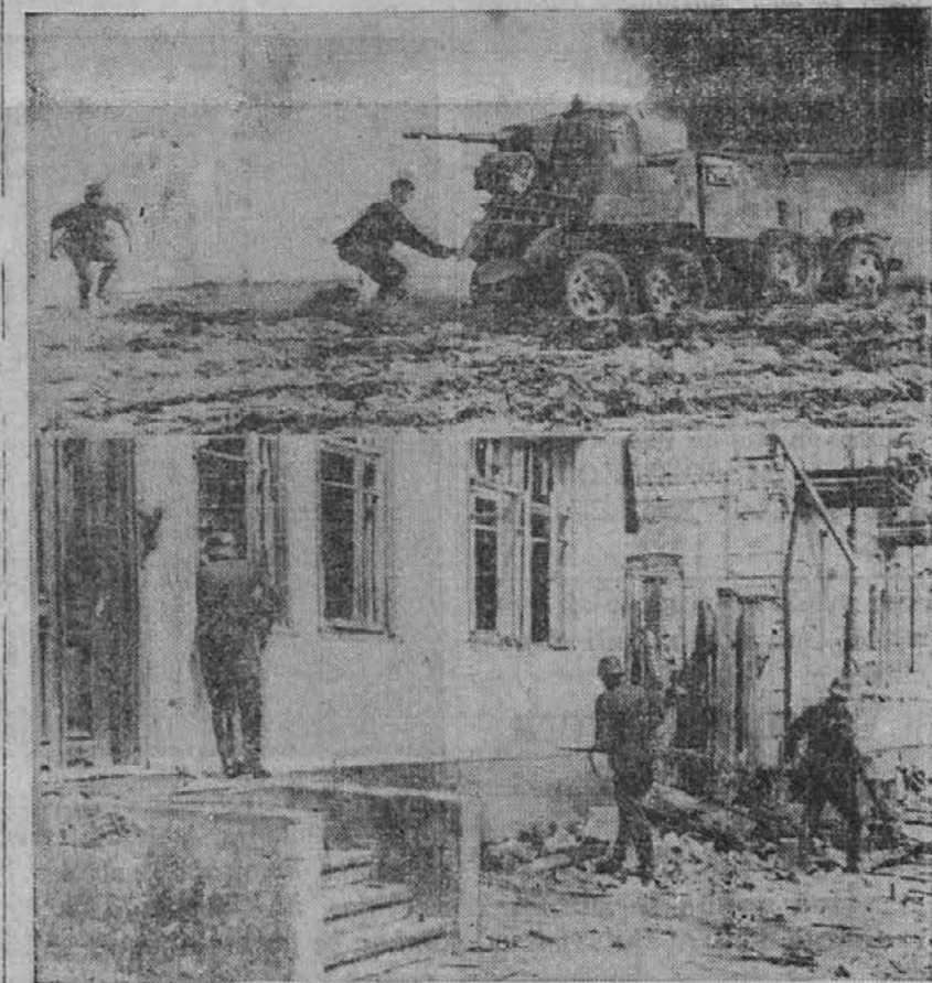
Na sliki zgoraj vidimo ustavljen ruski tank, kateremu se previdno bližata dva nemška vojaka z ročnimi granatami. Na sliki spodaj pa je videti nemške vojake, ki previdno preiskujejo v nekem zavzetem ruskem kraju hiše in okolico, da-li niso kje v zasedi ruski strelci.