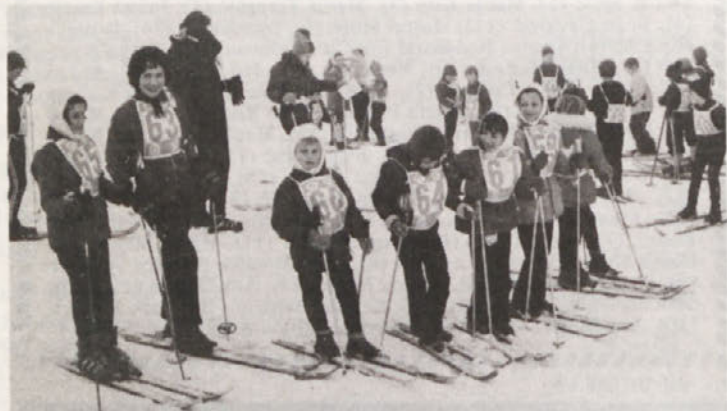
Od otroštva do starosti je za zdravje nujno potrebno gibanje

NOVOTEKS je glasilo tekstilne tovarne Novo mesto. Izhaja vsako prvo sredo v mesecu v nakladi 3400 izvodov. Urejuje ga izdajateljski svet: Franc Pavlin, Teodora Kovačič, Konrad Mehla, Marinka Miklič, Anton Pezdirc, Andrej Počrvina, Slavko Polak in Miran Simič. Predsednik izdajateljskega sveta je Andrej Počrvina. Odgovorni urednik Danilo Kovačič. Uredništvo in uprava: Novoteks, Novo mesto, Foarsterjeva 10. Stavak, filmi in prelom: ČZP Dolenski list, tiska Knjigotisk Novo mesto.