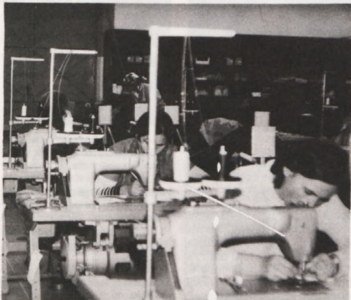
Naša prva skrb mora biti – človek