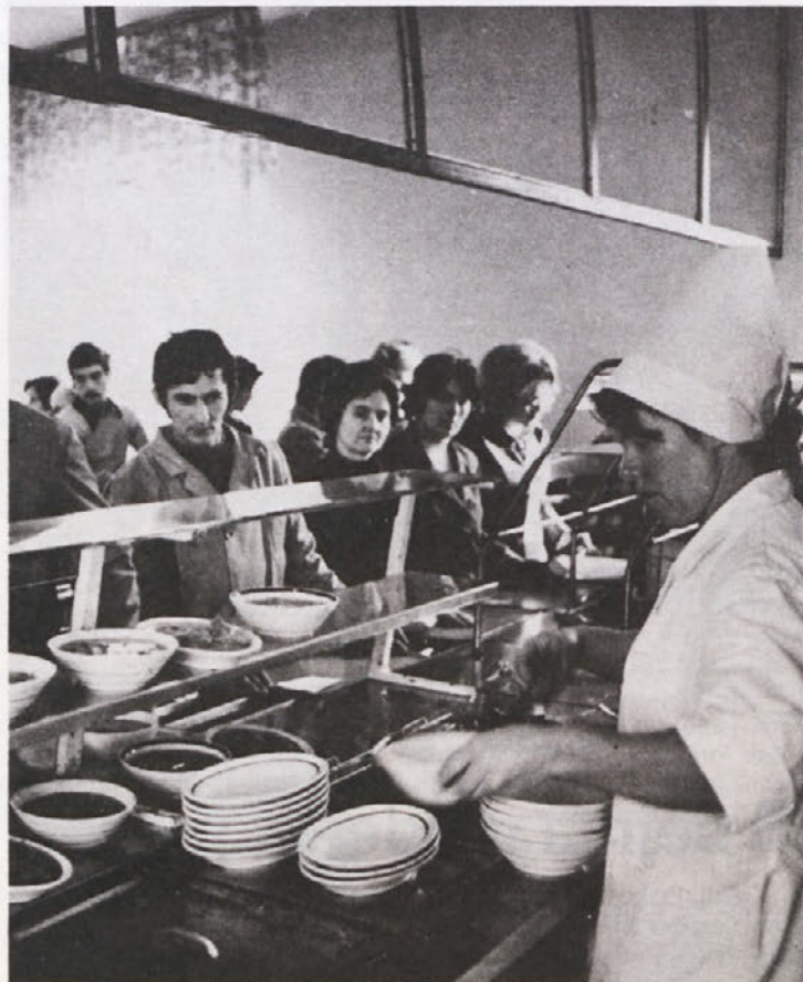
V času malice je v menzi vedno gneča