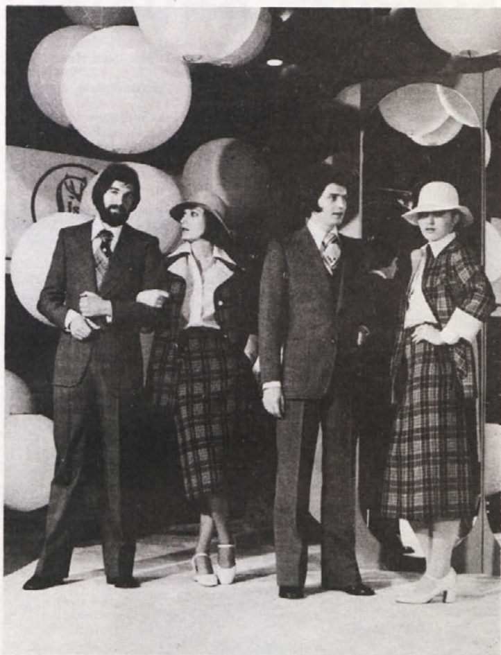
Naši modeli na večerni modni reviji

Proslava bo v zgornjem prostoru nove konfekcijske stavbe. Prosimo, da se proslave udeležite v čim večjem številu.