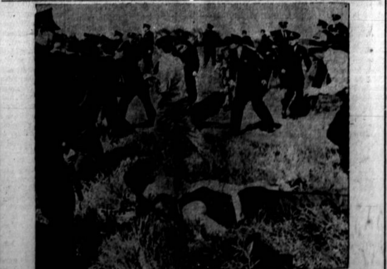
Slika kaže prizor iz policijskega napada na jeklarske stavkarje pred tovarno Republic Steel Corp. v Chicagu.