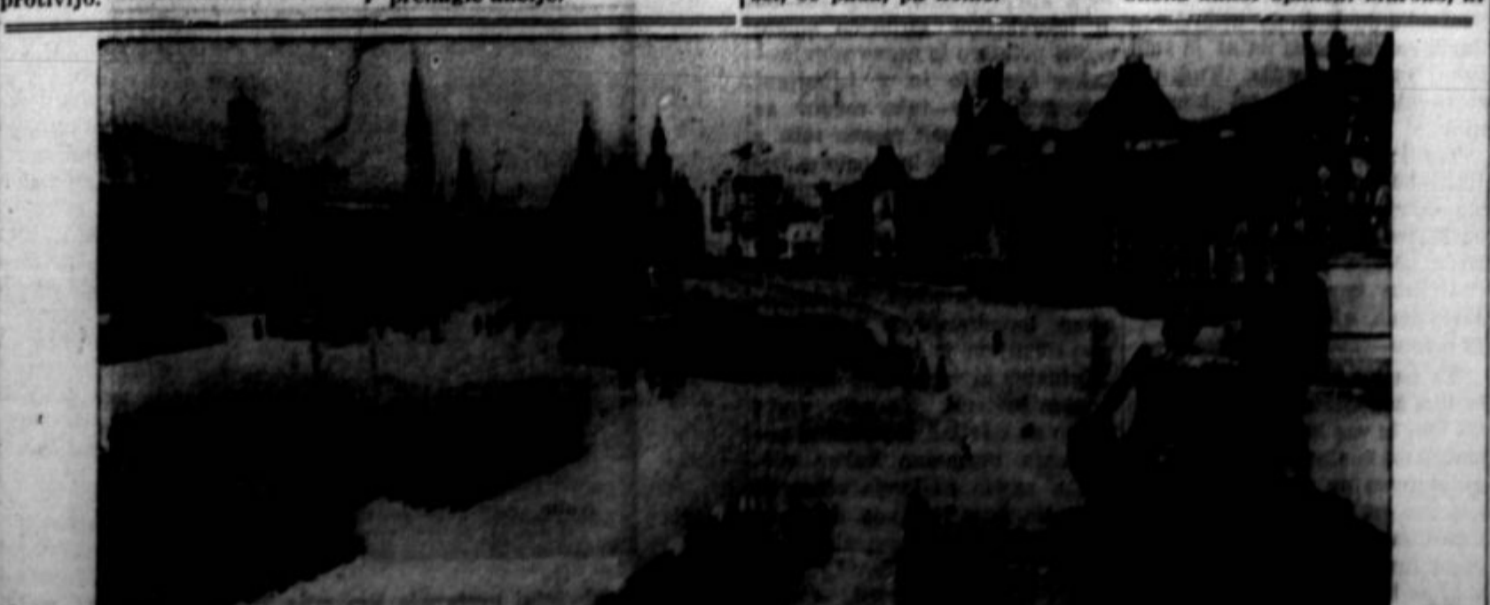
Prizor iz prvomajskih praznov na Rdečem trgu v Moskvi.

Velika jeklarška stavka je paralizirala tudi druge industrije in veliko število tovarn v dolini ob reki Mississippi je moralo ustaviti obrat, ker ne morejo dobiti jekla. Prizadete so tudi železnice, ker se je tovarni promet zmanjšal po izbruhu stavke. Vlni preiskovalci so na delu in zbrali so evidenco, ki potrjuje obdolžitve o grmadenju orožja v jeklarških tovarnah. Direktorji jeklarških korporacij so bili pozvani v Washington, kjer se bodo morali zagovarjati glede obdolžitve o kršenju federalnih zakonov.