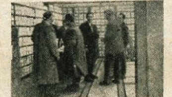
Pogled na prodajni oddelek nove prodajalne na Prešernovi cesti

Ravno potreba po sodelovanju s potrošniki je terjala, da je tovarna začela že kmalu po svoji