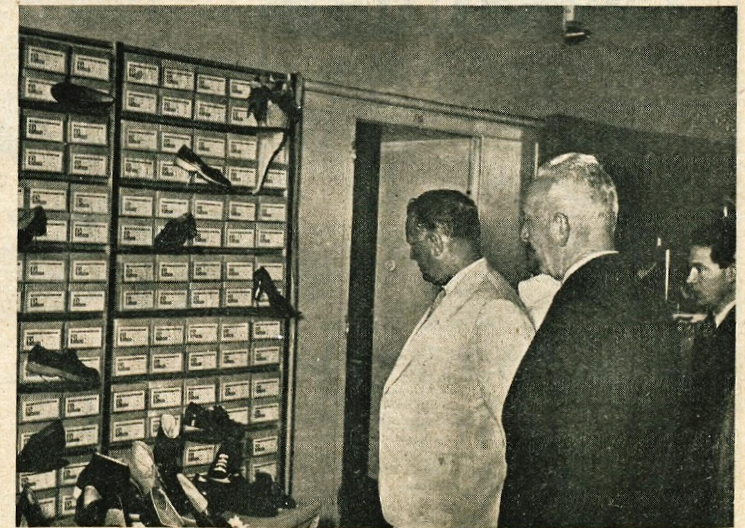
Maršal Josip Broz Tito si ogleduje razstavne prostore tovarne obutve »Planika« iz Kranja na lanskoletnem Gorenjskem sejmu.

Delovni kolektiv je prepričan, da bodo potrošniki s čevlji »oznako« »Planika«, še v prihodnje tako zadovoljni kot doslej. Tako delavci kot vodstvo podjetja pa se bodo potrudili, da bi našemu delovnemu človeku nudili še boljše in cenejšo obutev in ga tako kar se da zadovoljili!