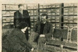
Prvi kupec, ki je stopil v novo prodajalno »Planika« na Prešernovi c. je dobil par čevljev zastonj

Katere? Vsak čevlj — izdelek, je podvržen strogemu pregledu posebne tovarniške komisije. Kritičnim očem ne uide tudi najmanjša napaka, ki jo povprečni potrošnik pravzaprav sploh ne opazi. Dosti je tudi najmanjši napačni vbod šila ali strojnih igel in čevlj ne dobi več ocenje: odlično! Postane tako ime-