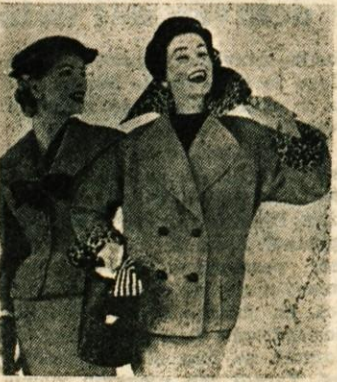
Zima nas kar noče zapustiti in naše nove kostime še vedno krasijo topli ovrtniki iz kožuvin.