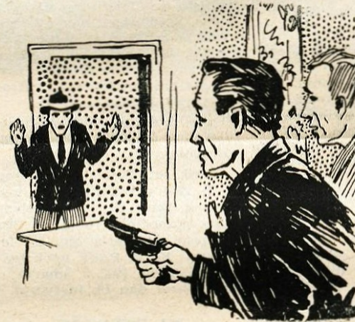
»Roke gor, ljubček!«

Adam je okamenel. Med vrati kopalnice sta stala dva človeka, eden je imel v rokah revolver. »Dovolite, da se predstavim«, se je samozavestno oglašil mož z revolverjem. »Sem hotelski detektiv in ta«, pokazal je na soseda, »je stanovalec v tej sobi. Na vašo nesrečo je — hotelski klepar.«