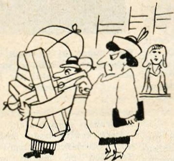
— Tako! Nesi vse lepo domov in nikar se ne oziraj za dekleti!