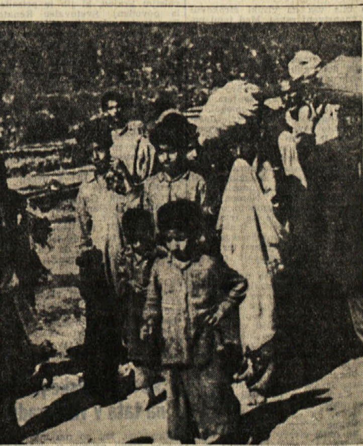
Kolone beguncev, kakršna je ta, lahko od začetka spopada v Kašmiru srečamo malodane vsako uro. Z vsem svojim imetjem na kamelah, se peš pomikajo čim dlje v stran od prizorišča krvavega obračunavanja.

Mladoletniki v Sovjetski zvezi store danes dvakrat manj zločinov kot leta 1940. Če se je v času vojne mladinski kriminal nekoliko dvignil, je to bilo moč pojasniti s težkimi in odvodnimi, ki jih je zahtevala vojna proti fašistični Nemčiji. Z odpravo vojnih posledic, pa je kriminal že v dobri meri padel, in to še prav posebno med mladimi generacijami. Nekaj števil: leta 1946, se prvi prvo leto po vojni, je udeležba mladoletnikov do 18. leta v skupnem številu obsojenih znašala 11,7 odst., leta 1954 se je zmanjšala na 5,8, leta 1959 na 3,3 in leta 1960 na manj kot 3