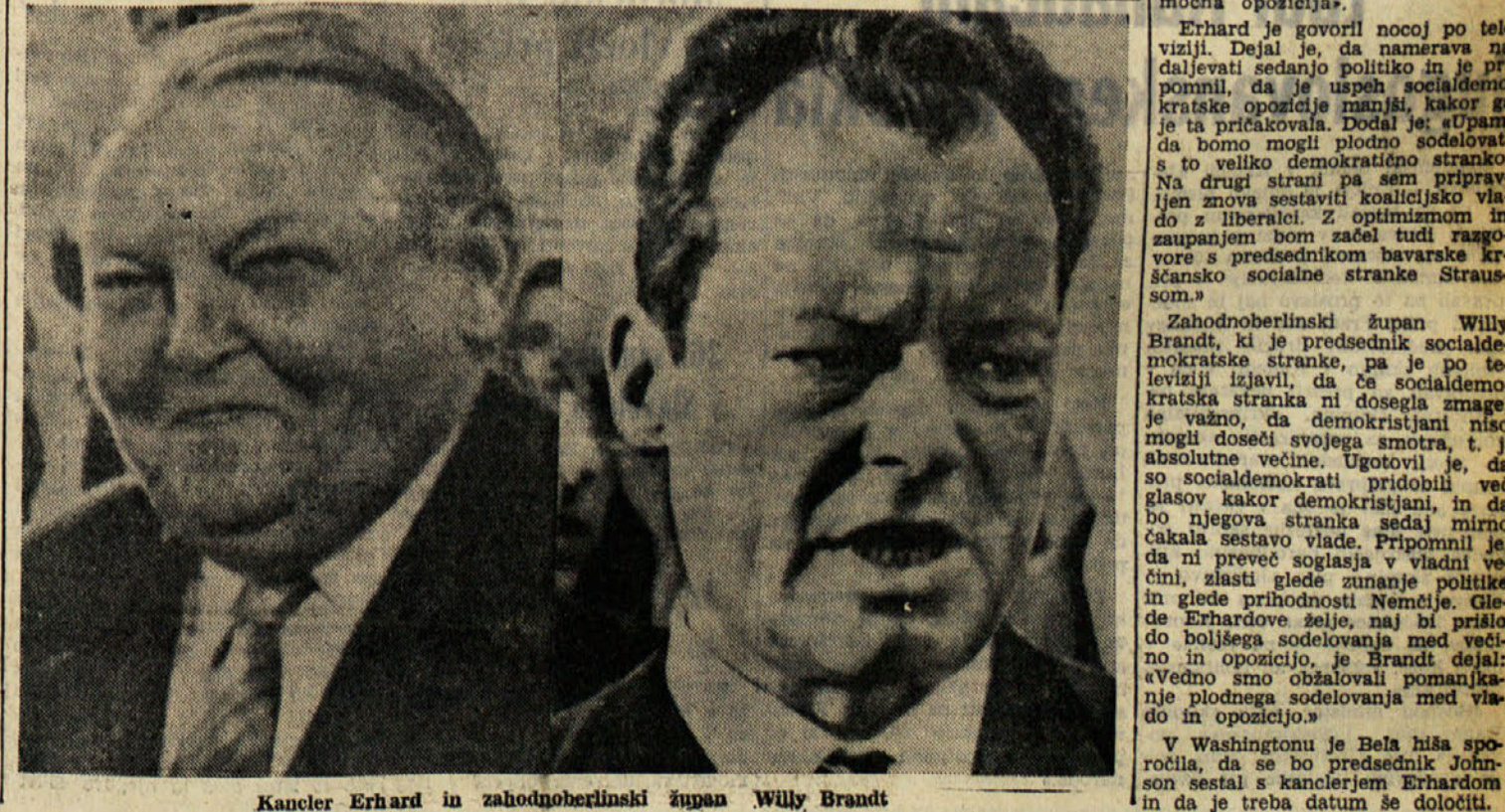
Kancler Erhard in zahodnoberlinski župan Willy Brandt

Predsednik sovjetske vlade Kosigin pa je povabil Šastrijo in Ajubu Kanu, naj se sestane na sovjetskem ozemlju, ter je ponudil tudi svoje posredovanje. Danes se začne v New Yorku dvajseto zasedanje skupščine Združenih narodov, na žalost v ne preveč naklonjenem ozračju spritvo v zvezi z Azijo. Za predsednika skupščine bo verjetno izvoljen italijanski zunanji minister Fanfani, ker je Jugoslavija sporočila, da Koča Popović ne bo kandidiral. Nedeljske volitve v Zahodni Nemčiji niso v glavnem prinesle nobenih sprememb če upoštevamo sedanjo koalicijsko skupaj kot enoto. Napredovali so demokristjani na škodo liberalcev, v še večji meri pa so napredovali socialisti. Demokristjani so vedno absolutno večino. Demokristjanska stranka je ponovno imenovala Erharda za predsednika vlade. Predsednik republike Saragat nadaljuje obisk po državah Latinske Amerike in je včeraj prispel v perujsko prestolnico Limo.