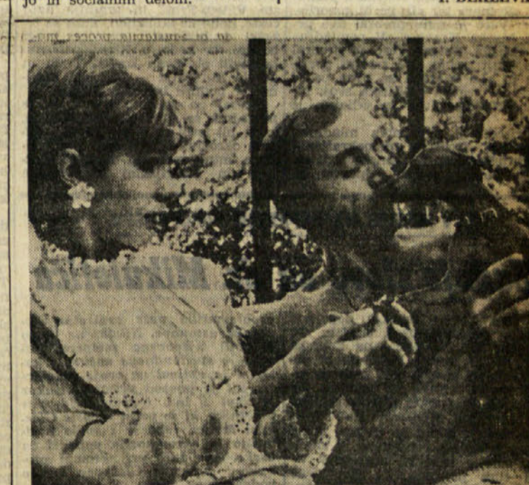
Francoski pevec in filmski igralec Anzavour snema zdaj, skupaj z angleško igralko Susan Hampshire, film »Paris v mesecu avgustu«. Trenutno so s snemanjem filma morali prenehati, ker so ga napadle bolečine v križu.