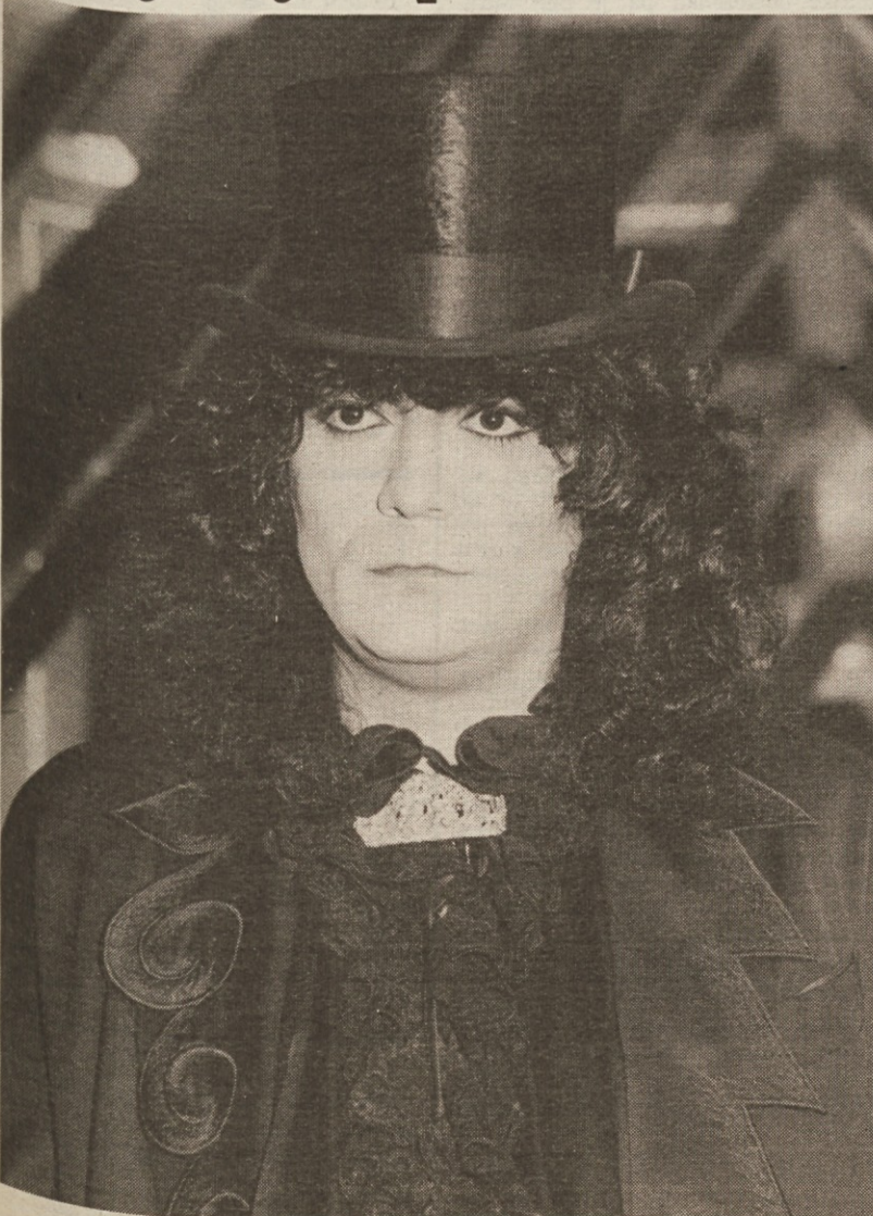
Renato Zero sodi med najbolj popularne italijanske popevkarje