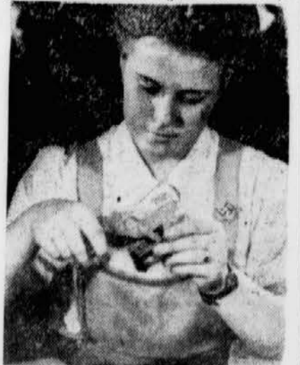
Im Laboratorium versteht das Hilfsdienstmädchen ihren Dienst wie an der Maschine

Einzelarbeit erhält ihren neuen Wert. Für die meisten Frauen bedeutet der Übergang aus ihrem bisherigen Wirkungskreis in die Rüstungsindustrie einen schweren Entschluß.