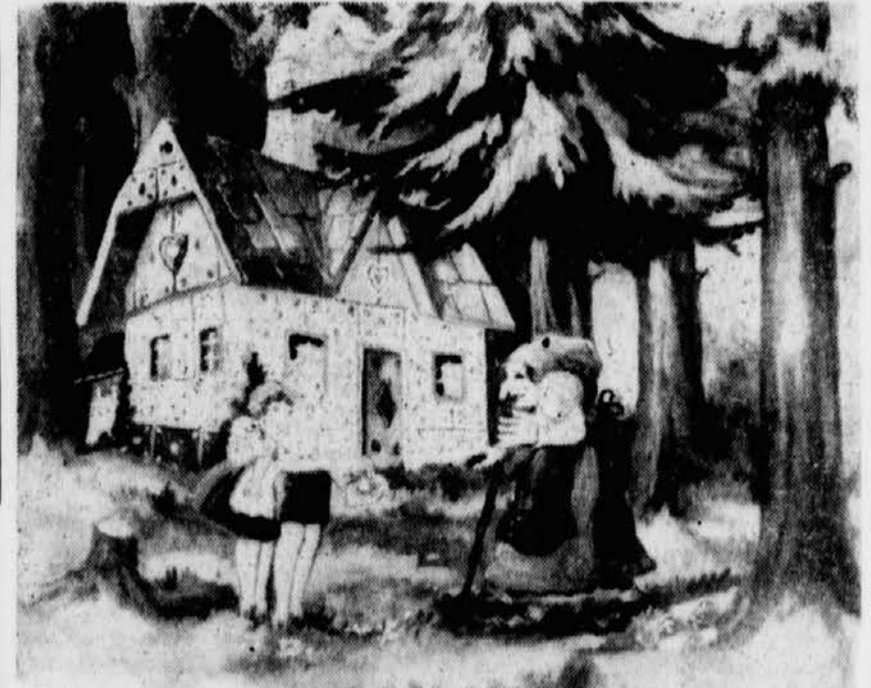
Hänsel und Gretel - in bunten Temperafarben an die Wand gezaubert

unserer alten, deutschen Märchen gelang Ussar das Kunstwerk. Er ließ seiner Phantasie freien Lauf und ohne Vorlage, gleichsam aus dem »Handgelenk« heraus wuchs da der Märchenwald hervor, trefflich gesehen und farbenfreudig in Temperafarben gemalt.