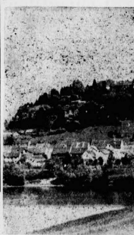
Lichtenwald begehrt am Samstag und Sonntag den Ortsgruppentag

Als einzige Ortsgruppe im Kreis Rann führt Lichtenwald seinen Ortsgruppenname durch. Der Ort selbst liegt im Sawetal neben Eisenbahn und Straße, bestimmt vom Verkehr zu leben und dem Verkehr zu dienen.