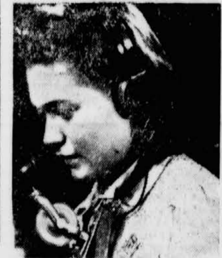
... und als Telephonistin

»Schneewittchens, Freude der Kinder in einem neuen Gewand, zu Nutz und Frommen der Kinder, denen die schönen Wandmalereien helfen werden, durch ihr Betrachten tiefer und ursprünglicher in deutsches Wesen eindringen zu können.