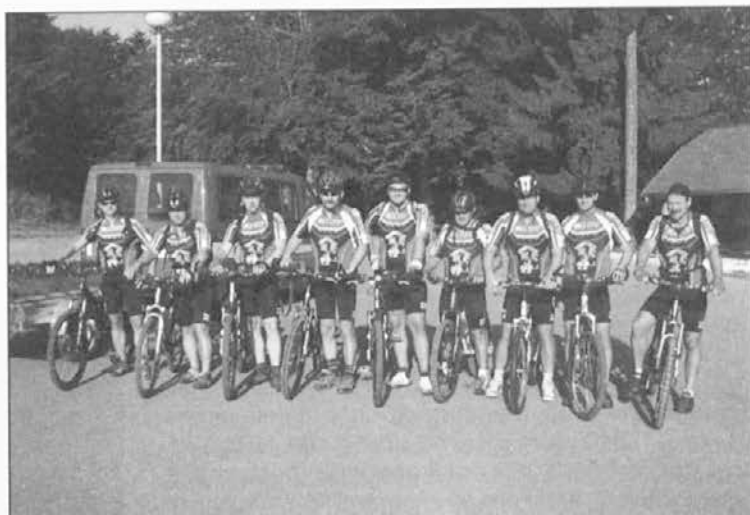
Pred tradicionalno turo preko Pohorja.

Ker z rekreacijo zaposleni skrbijo predvsem za telesno kondicijo in dobro počutje, spoznavanje novih krajev in prelepe slovenske pokrajine, je naša želja, da bi se še kdo od zaposlenih, morda tudi kakšna sodelavka, odločil za sodelovanje v sekciji. Prav zadnja naša želja pa je, da bi nas v matičnem podjetju vzeli pod svoje okrilje ter bi na dresih zasijalo ime dobrega in zelo uspešnega podjetja.