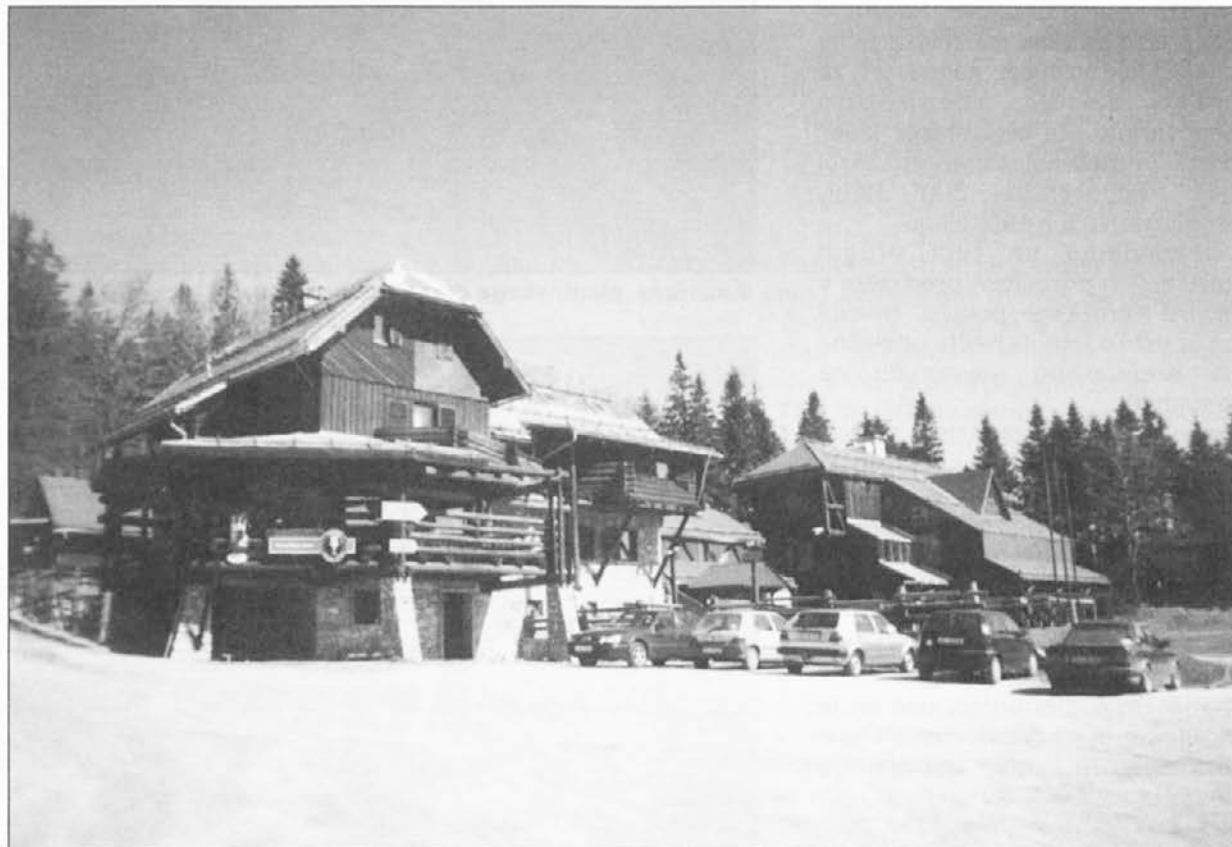
Grmovškov dom na Pungartu.