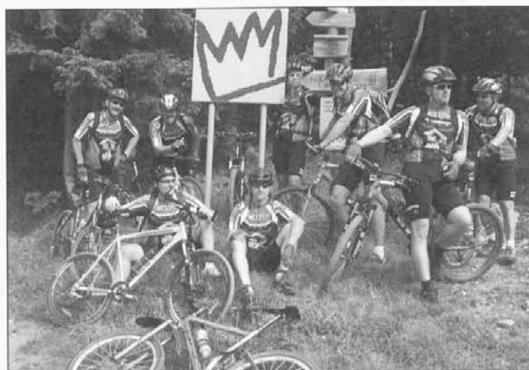
Počitek med kolesarjenjem čez Smrekovec.