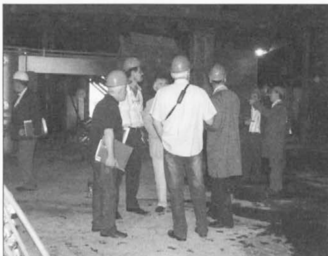
Med ogledom jeklarne.