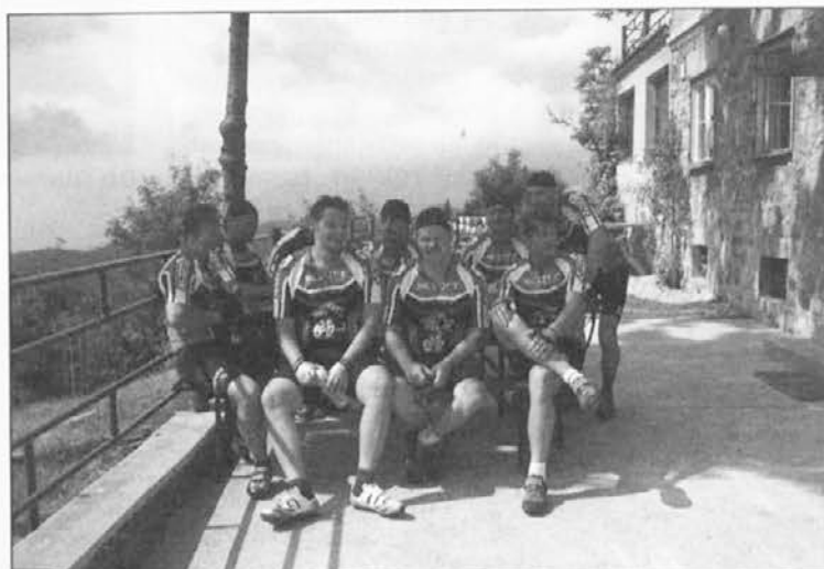
V zavetju planinskega doma na Slemenu.