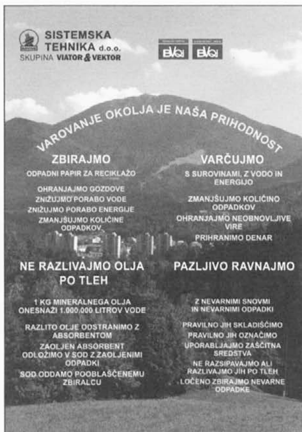
Plakat z namigi za varovanje okolja.