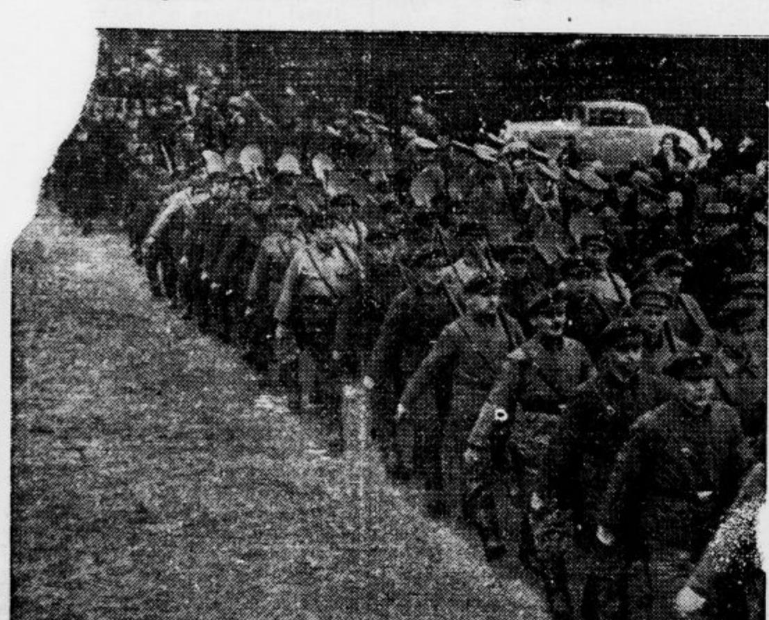
Oficirji nemške vojske poučujejo uniformirane brezposelne v vojaških spretnostih. Za sedaj nosijo še lopate, kmalu pa bodo nosili puške!