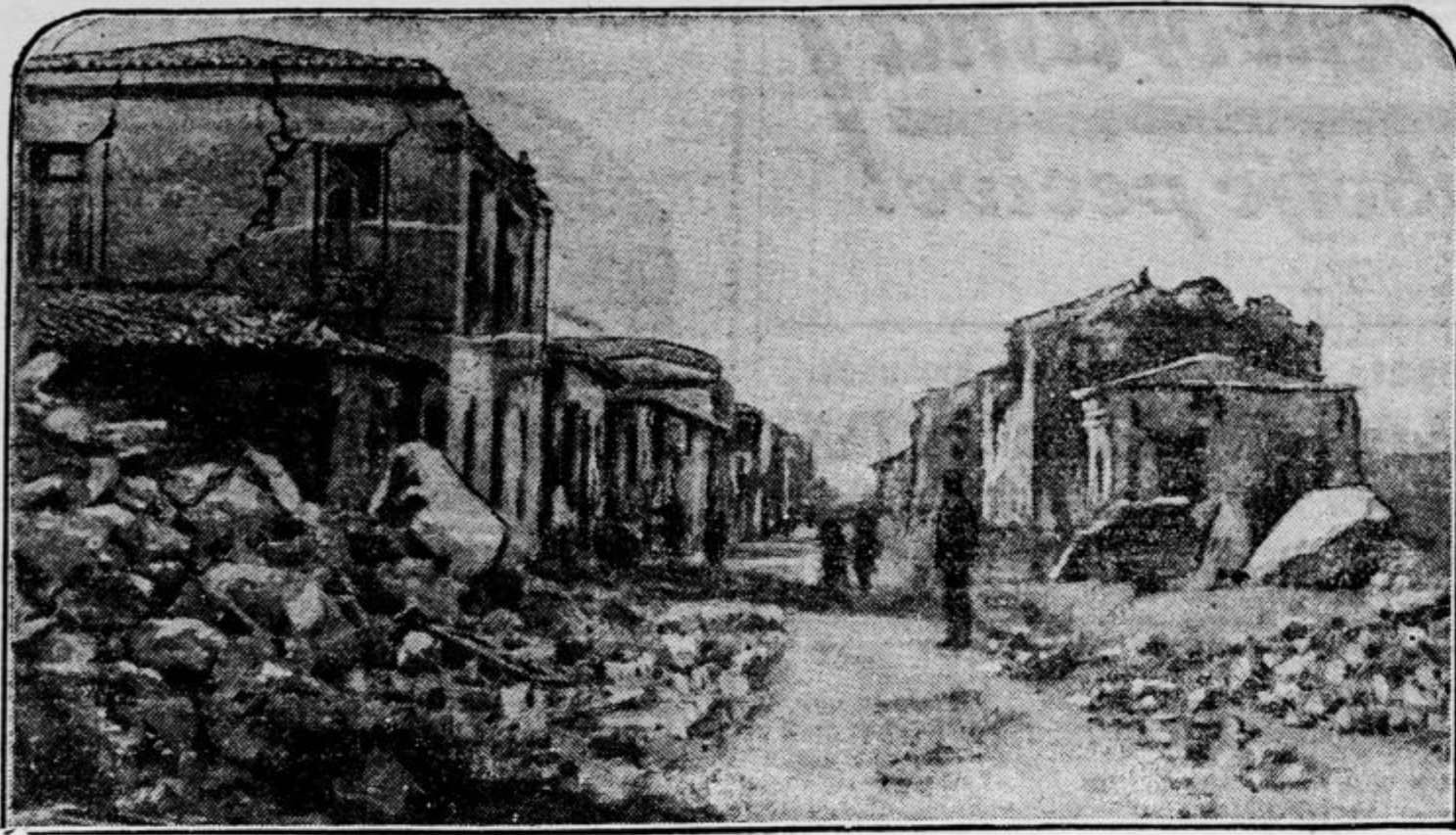
Strahote potresne katastrofe v Korintu. Glavna ulica nesrečnega mesta po potresu.