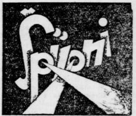
mojstrsko delo slavnega FRITZ LANGA.

Izgubil se je mlad pes-čuvaj volčje pasme. Ime »Lord«. Vrnite ga proti nagradi! Leben oper. gledališče.