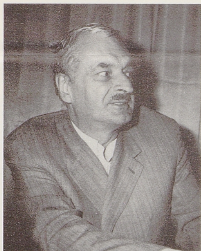
Dr. Vladimir Murko je predaval o tedaj aktualni temi »Politično-ekonomski položaj Slovenije po zveznih ustavnih dopolnilih« (1971)