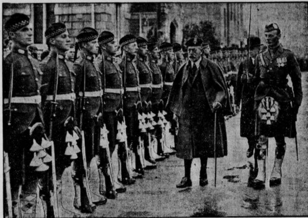
Angleški kralj Jurij je pregledal škotske čete v mestu Ballater. Nadel si je škotsko obleko.

Kakor vidite, se tudi holandska vojska pridno vadi. To je prizor z vojaških vaj v severnem Brabantu. Na sliki vidite strojnico, ki so jo postavili na motorno kolo. Doslej je vozila strojnica na motornem kolesu s »sidecarom«. Tudi v tem pogledu nov napredek: strojnico lahko prepeljujejo že na navadnem motornem kolesu.