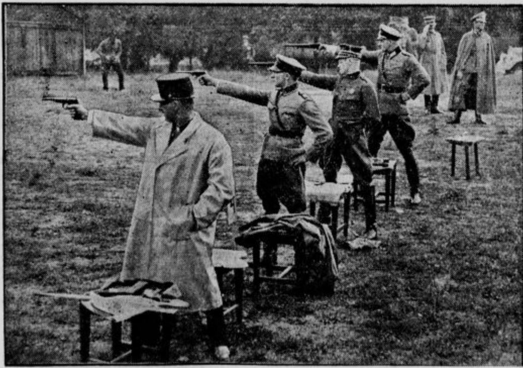
Švedsko vojaško športno društvo je praznovalo 25 letnico svojega obstoja na ta način, da je organiziralo strelsko tekmo. Te se je udeležilo 5 držav. Zmagal je Šved. Na sliki prizor s te tekme, ko streljajo s pištolami. Od leve proti desni: Madjar, Fincec, Šved in Nемец.