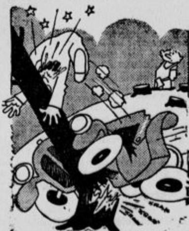
Kraeni ljudje, ti avtomobilisti... prihranil mi je vsaj dobre pol ure dela.

Praški etnografski muzej urejuje tudi poseben oddelk narodnih noš vseh slovanskih narodov. Te dni je bila muzeju poklonjena velika zbirka narodnih noš iz Dalmacije.