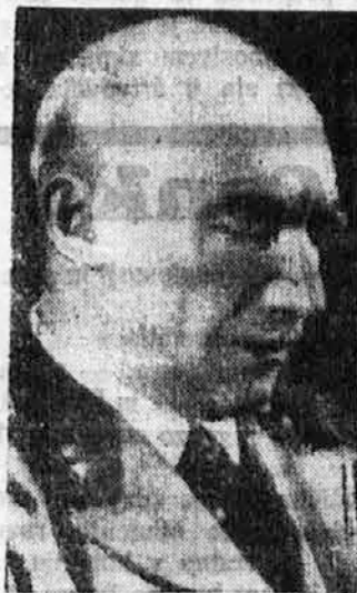
General Pariani, šef italij. gen. štaba, se mudi sedaj v Nemčiji.

Svetilka sama ima obliko dolge cevi, izdelane iz posebnega stekla in je napolnjena s hlapi živega srebra skupaj z redkima plinoma neonom in argonom. Električnega toka porabi zelo malo, komaj desetino toliko kakor navadna električna žarnica. V bankah in drugih javnih uradih lahko namestimo to svetilko pri oken-cu tako, da nastaja žareča pregrada med uradnikom in stranko. Tako je uradnik zavarovan pred okuženjem z raznimi od zunaj prenešenimi bacili. V živalskih in drugih trgovinah se rabi ta žarnica za steriliziranje prodajnega blaga. Posebno važno vlogo pa igra ta svetilka v bolnicah pri operacijah, kjer se sterilizira z njeno pomočjo zrak in seveda tudi medicinski instrumenti.