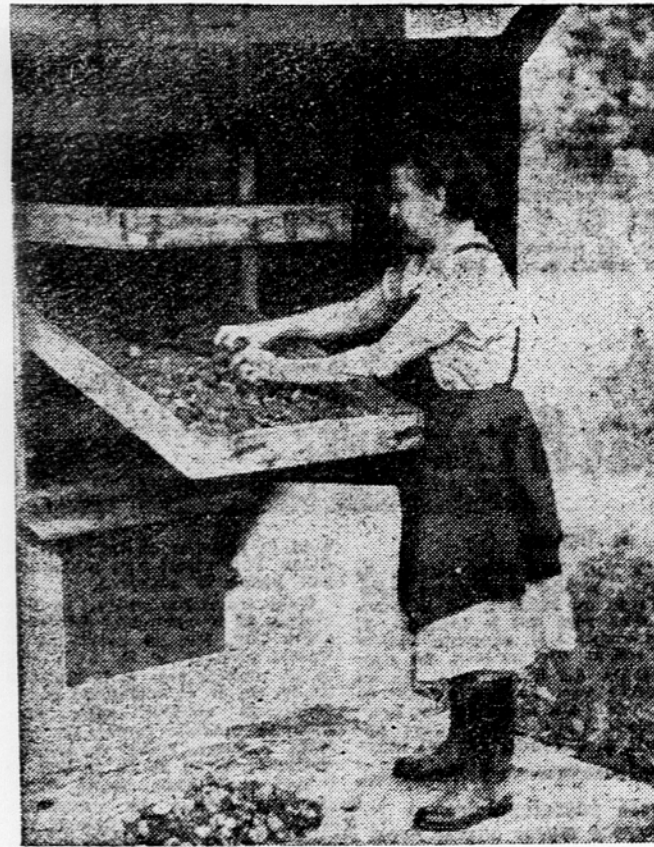
Letošnja sadna letina bo marsikje omogočila sušenje večjih količin sadja. — Na sliki: poljska sadna sušilnica