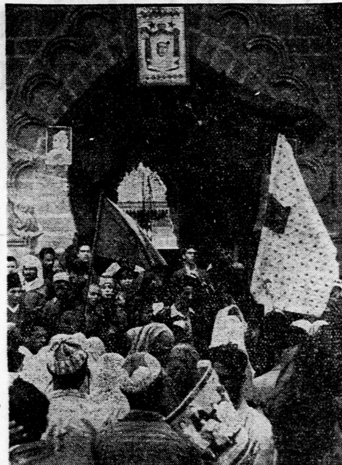
Maroški sultan Ben Jusuf se bo 18. ali 19. novembra verjetno vrnil v Rabat in zasedel prestol. Medtem pa so po vsem Maroku živahne manifestacije za odstavljenega vladarja. Mnogi nosijo v sprevidih po ulicah vladarjevo sliko in zahtevajo njegovo čimprejšnje povrnitev. Naša slika kaže množico pred okrašenim vhomom v veliko džamijo v Casablanci.

Zahodnonemški izvoz avtomobilov. Zahodnonemški izvoz avtomobilov je bil v prvih 9 mesecih tega leta za 43,8 % večji od izvoza v istem razdobju lanskega leta. Od januarja do septembra je bilo izvoženih 292.940 vozil, v primerjavi s 203.709 vozil, ki so jih izvozili v prvih devetih mesecih leta 1954. Skupna proizvodnja se je povečala za 34,6 %, to je od 488.082 na 657.191 vozil.