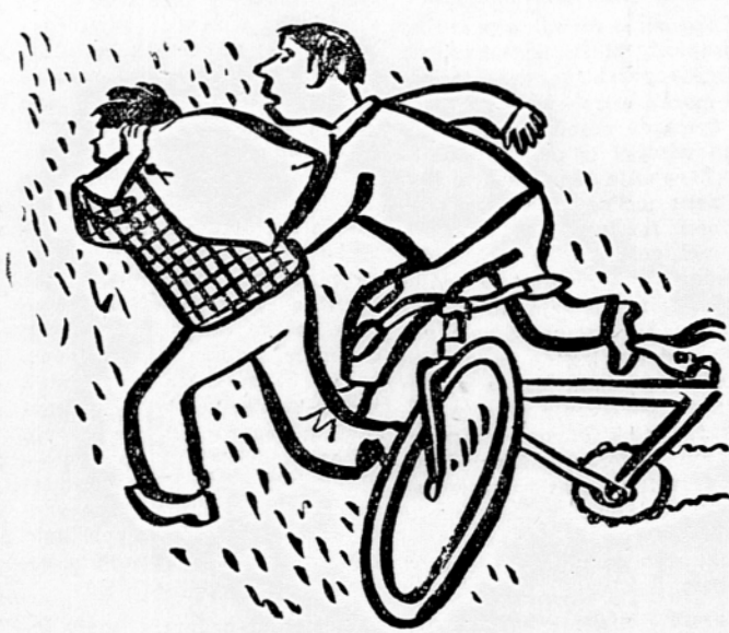
Kaj bo iz njiju?

Tiho, neopazno se odvijajo življenjske vzgojne posvetovalnice na Kodeljevem, ki pa je že marsikateri družini vrnila otroka. V. K.