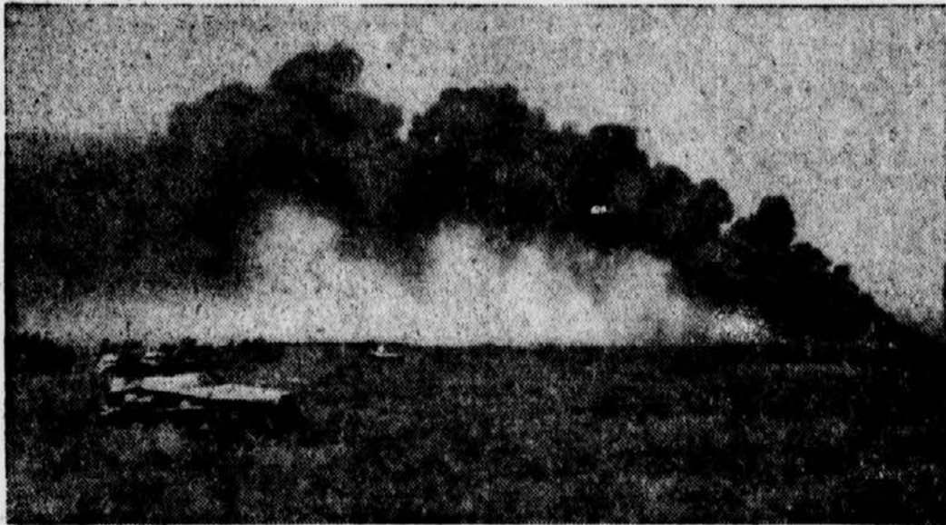
PK-Kriegsbericht Grimm-Kastein (Sch)

Seit der Verhaftung Gandhis und vieler anderer politischer Führer haben die britischen Behörden einen Terror gegen das indische Volk entfesselt, der immer größere Ausmaße annimmt. Männer und Frauen, die an indischen Kundgebungen teilnehmen, werden niedergeknüpelt, wobei der »Lathi«, ein bleigefülltes Bambusrohr — wie schon in frühern Jahren — regiert