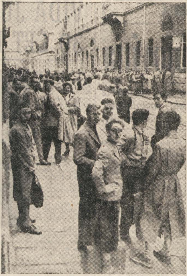
Slovenski dijaki so že mnogokrat odločno pokazali, da ne bodo doživljali usode svojih staršev, da nocoj ponovnega suženjstva. Na sliki prizor z demonstracij slovenskih srednješolcev proti znanemu krivičnemu anglo-ameriški sklepu.

meravajo dati izpraznjen prostor italijanskim ustanovam. Na občnem zboru je bilo tudi govora o drugih šolskih vprašanjih, in med drugim o vprašanju učbenikov, katerih izdaja je ovrhana zaradi dveh italijanskih profesorjev v posebni komisiji, ki seveda ne znata slovensko in ne moreta izreči svojega mnenja o predloženih knjigah. Ves skupek šolskih vprašanj, od katerih smo našli samo nekatera najbolj pereča, pa je nastal zlasti zato, ker upravljajo slovensko šolo še vedno italijanski iredentisti, ker ne moremo Slovenci niti o tem osnovnem vprašanju odločiti sami. Prav zaradi tega je še toliko bolj umiljiva zadnja točka resolucije društva, ki odločno protestira proti prihodu Italije v Trst.