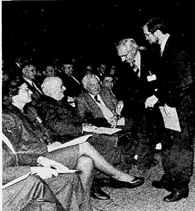
UGLEDNI GOST - Prvega kongresa Gospodarskega foruma se je udeležilo okrog 250 uglednih gospodarstvenikov in gostov. Med njimi je bil tudi Romeo Fatori, predsednik italijansko-slovenske trgovinske zbornice, ki se je zavezal za krepitev sodelovanja med državama, njegov odmeven nastop pa je navdušil tudi našega znanega ministra in podpredsednika vlade Lojzeta Peterleta.

MITJA GASPARI je med drugim tudi povedal, da bi se morale povprečne plače v Sloveniji vrniti na izhodnice iz sredine minulega leta, torej bi se morala povprečna izhodniška plača gibati med 550 in 560, največ 600 markami. Prihodnje leto se bodo morale plače zmanjšati za približno 5 odstotkov.