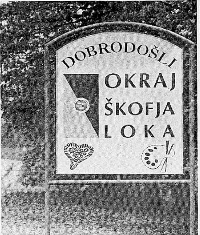
PONEKOD SO POHITELI – Škofjeločani so že postavili tablo z dobrodošlico v njihov okraj.

Upravnih sporov, pri katerih vrhovno sodišče presoja zakonitost izdanih odločb o državljanstvu, kakor tudi spori zaradi odločb inšpekcijskih organov, še nekaj temu pa spisi, ki so svoji vsebini ne sodijo med prednostne primere, ne bodo rešeni prej kot v letu dni. Z zdaj oddelku za upravne spore prednostno rešuje le zelo omejeno število zadev.