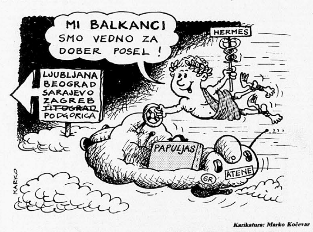
Karikatura: Marko Kočevar