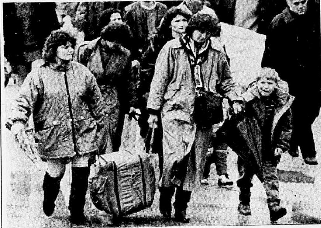
VČERAJ JE ZNOVA ODPADEL ODHOD V BEOGRAD - Na stotine bosanskih Srbov se ponovno pripravljajo na odhod iz Sarajeva, ki so ga večkrat načrtovali že od letošnjega januarja naprej.