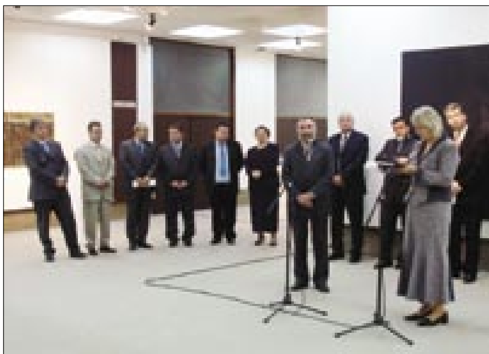
Kljub številnim govornikom: iz diplomacije, politike in kulture je minila otvoritev hitro in prijetno, v odlični organizaciji sombotelske galerije.