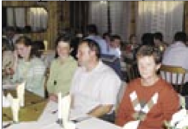
Na prijateljskom srečanji

V soboto zazranka v šestoj vöri so sedli na autobus pa so v pauj edenajstoj stopili dola z autobusa pri baziliki sv. Štefana. Poglednili so si relikvijo tö, pravo rokau sv. Štefana, stero 20. augustuša kaulak nosijo na procesiji pri bazili-