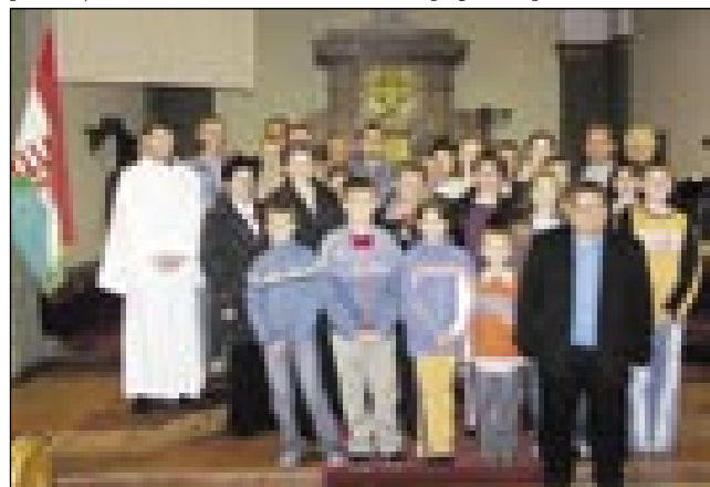
Gorenjesenički cerkveni pevski zbor z gostitelji

kazala vse. Vidli smo korono, sablo, državno jabolko pa žezlo (jogar). Vidli smo tisto dvorano, dej poslanci majo svoje djilejše, prinesejo zakone.