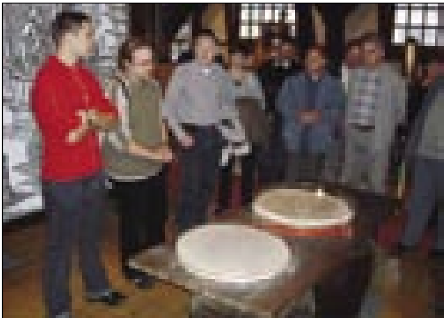
V muzeji pivovarne Union

Potejn smo tašo veliko bečko zaglednili, gde so gnauksvejta šor držali, ka vsi, ka smo iz Porabja bili, bi meli mesto v njej. Gda smo si muzej poglednili, te smo prejkšli v fabriko, gde smo leko vidli, kak se gnesden šor dela. Prvin so kauli mogli ojditi pa so tak kontrolirali faze, gda se šor dela. Zdaj tau že eden človek tanapravi pa ma ranč nej trebej kraj od računalnika titi. Lampe so nam oprejte ostale, gda smo vidli, kak dosta šora majo v skladišči. Trideset mejtrov visiko samo puno lad bilau. Če bi Andovčani den nauč samo šor pili, ešče tak bi vejn stau lejt nej vse spili. Dosta vse zanimivoga smo vidli pa čüli, dapa meni se je