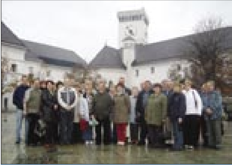
Člani občnega zbora Državne slovenske samouprave in njihovi družinski člani na ljubljanskem gradu

taši, šteri so prajli, ka tau oni doma tō vōsprobajo. Vejpa ta fabrika je tō namala začnila, zaka bi se njim nej posrečilo. Edno krčmau so meli v muzeji vōnapravleno, štera je cejlak tak vōgledala kak pred stau lejti nazaj. Več ji je prajlo, ka baugivala, ka si malo dola leko sedemo na edno pijačo, dapa včasim jim je vola odišla, gda je vodič pravo, ka tau se tō k muzeji drži.