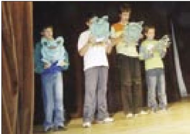
Nastop vojvodinskih otrok na Gorenjom Seniki