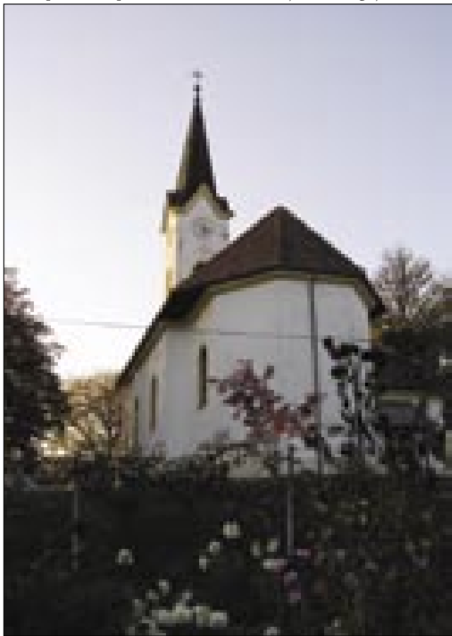
Pogled na večer proti cerkvi sv. Sebeščana iz jugovzhodne strani

krščanski tempel, čiglij je tau moglo gvüšno biti ešče v srednjom veki, se pravi v cajti, gda so kraj pa verniki spadali pod martjansko faro. Kakša je bila bi glij tak samo