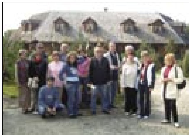
Gostje na Verici pred panzionom Ružič

Po programi je Zveza vse navzauče pozvala pa skromno pogostila v klubi, gda se je publika tü leko malo vö nagončala. Gostje iz Subotice so bili fejs srečni pa radi, ka so tašni lejpi, veseli program leko vidli, pa ka so njivi mlajši telko lidam leko špilali svoje igre