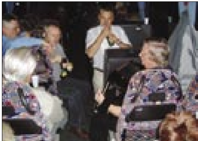
Na avtobusi je bila ta pa nazaj glavna harmonika

gde so notrapokazali zgodovino pivovarne od leta 1864 do gnesden. Za filmom smo