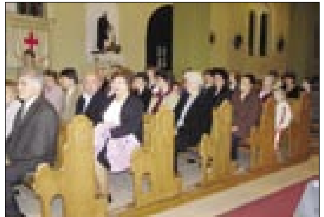
Budimpeštanski Slovenci so se lepau zbrali

pa že vsi žedni bili. Od tec nas je paut pelala na Budimski grad, na Ribiško trdnjavo. Vidli smo palačo, dej dela državni predsednik László Sólyom. Matjažovo cerkev smo samo zvüna leko poglednili, ka go popravljavo.